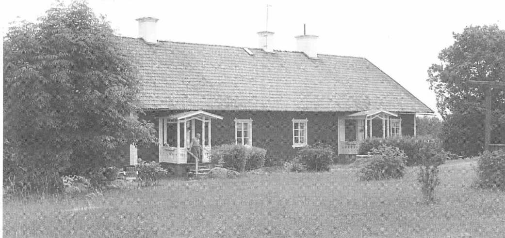
Fasterna hembygdsförenings nyinköpta hembygdsgård i byn Granby.

förvärvat fastigheten Granby 2:7 för 950.000 kronor. Detta beslutades enhälligt vid ett föreningsmöte 19 augusti på Rånäs slott.