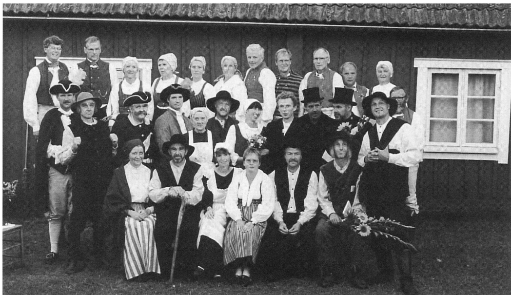
Teatergruppen 1998. Bygdespelet "Vården till eget minne" skrivet av Karin Ahlinder.