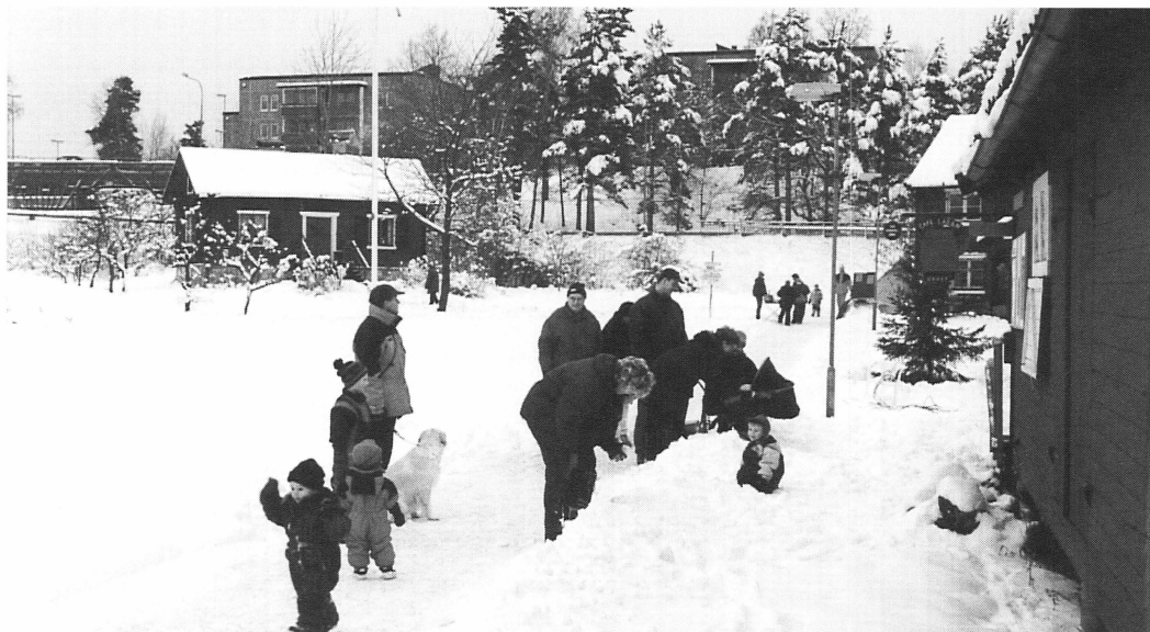
Hembygdsföreningens Julmarknad 12 december 1998.

av 90.687 kronor, och invigdes högtidligen den 18 april. Här har vi tillfälliga utställningar, arkiv, pentry, toalett (numera året runt!) och styrelsemöten.