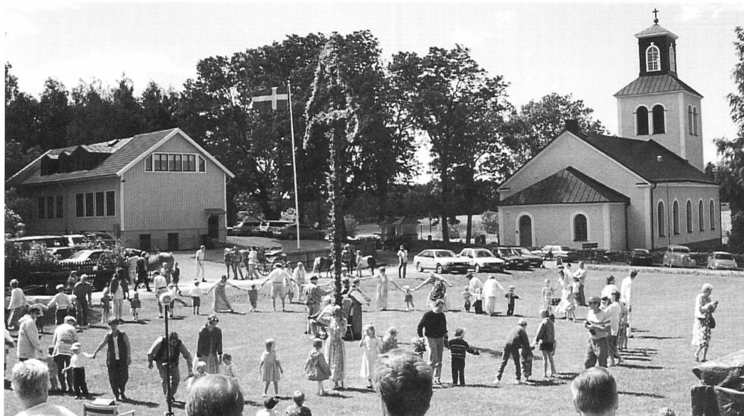
Det årliga firandet! År 2000 har vi 10-årsjubileum för midsommarfirandet i regi av Hagby Hembygdsförening. Det kommer cirka 250 personer varje gång

midsommarfirande vid hembygdsgården. Hit hör också slätterkväll i mitten av juli, liksom firandet av gammaldags jul, som även i år var välbesökt.