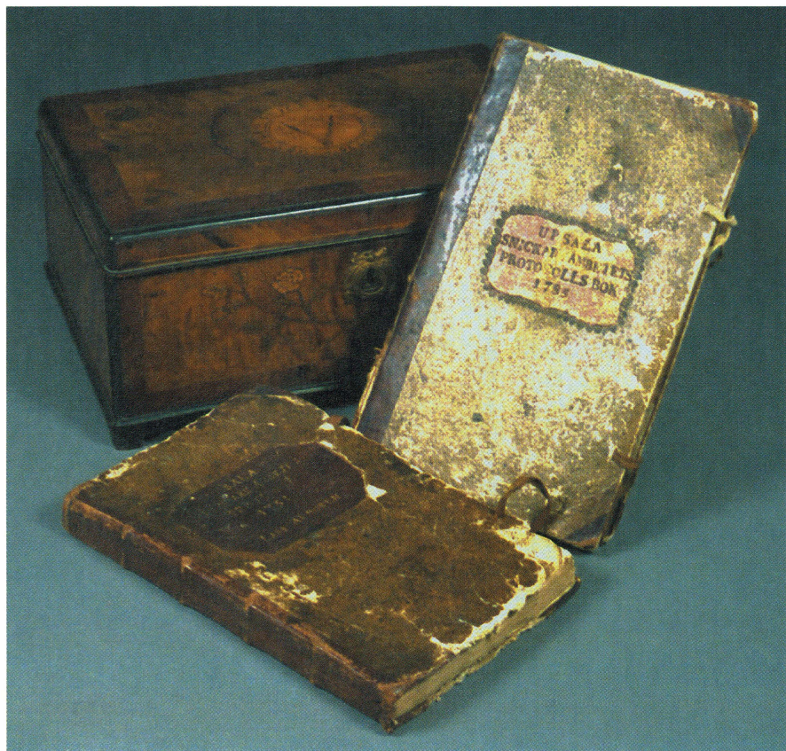
Uppsala snickareämbetes skralåda med innehåll, d.v.s. två protokollsböcker från ämbetets sammankomster 1751–1845.