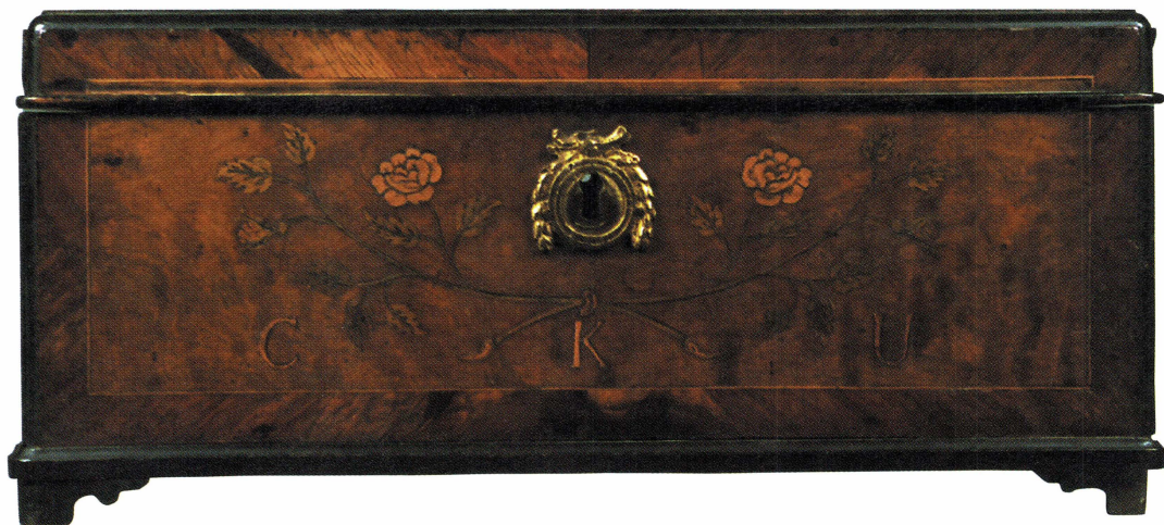
Skrålådans framsida med inläggningar, nyckelskylt av brons och tillverkarens signatur CKU, d.v.s. Carl Knut Unander.

(Egenhändiga underskrifter av J. Holmgren, P. Widin, M. Alander, C. Rolinder och O. Lundberg)