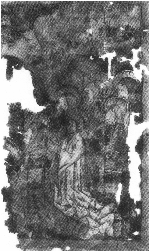
Bild 9. Senmedeltida processionsfana. Kristi himmelfärd, höger sida av den ursprungliga framställningen, vänster sida saknas. Fotograferad med infrakänslig film.

tas, framför allt är gloriorna tydliga. Bakom dem ses två pelare med kupolliknande krön av rött tegel. Längst upp till höger – rakt ovanför Maria ses Guds välsignande hand inom en molnkrans, nedanför denna återfinns vi den ena vingen av den Helige Andes duva. Resten av duvan samt Guds