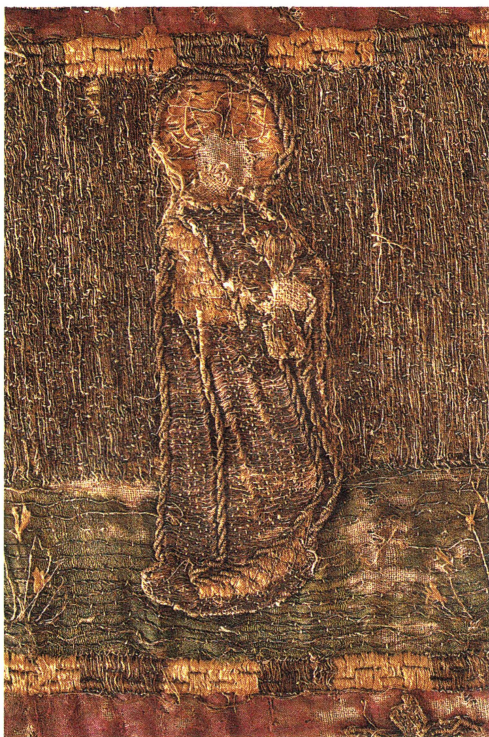
Bild 4. Senmedeltida broderat altarbrun. Detalj med aposteln Johannes.

de på rad med jämna avstånd. Figureorna står på en grön markremsa, som löper längs altarbrunets hela längd innanför den smala bården av en vinranka. Tydliga märken visar var figureorna ursprungligen stod, bl a är fötterna i många fall bevarade. Mellan figureorna på den gröna markremsan ser vi blomstertuvor. Bakgrunden, mot vilken figureorna avtecknar sig är nu gråaktig men var ursprungligen gyllene. Figureorna bär nu gråaktiga mantlar, ursprung-