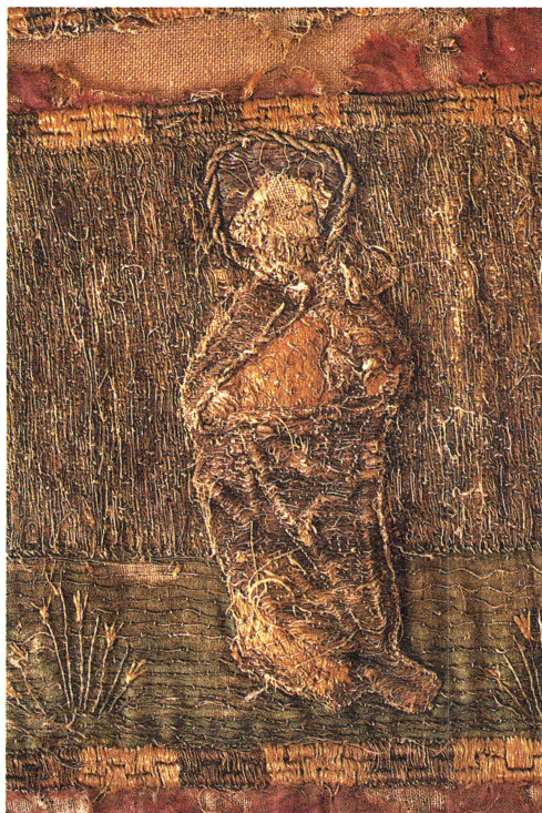
Bild 3. Senmedeltida broderat altarbrun. Detalj med aposteln Petrus.

Den hopknycklade högen i vilken enstaka broderitrådar av senmedeltida karaktär hade iakttagits redan vid besiktningen i kyrkan visade sig utgöra resterna av ett senmedeltida altarbrun. Altarbrunet är svårt skadat och i två delar, stycken saknas också. Trots det fragmentariska skicket kan man efter konserveringen och den vetenskapliga undersökningen bilda sig en