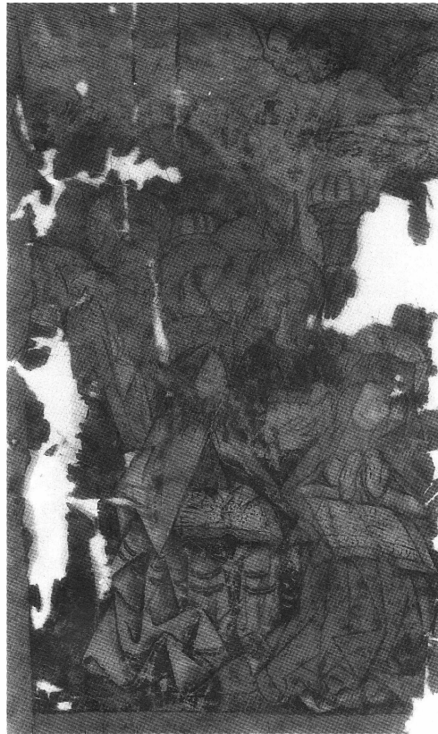
Bild 10. Senmedeltida processionsfana. Pingstundret. Vänster sida av den ursprungliga framställningen, höger sida saknas. Fotograferad med infrakänslig film.

tas, framför allt är gloriorna tydliga. Bakom dem ses två pelare med kupolliknande krön av rött tegel. Längst upp till höger – rakt ovanför Maria ses Guds välsignande hand inom en molnkrans, nedanför denna återfinns vi den ena vingen av den Helige Andes duva. Resten av duvan samt Guds