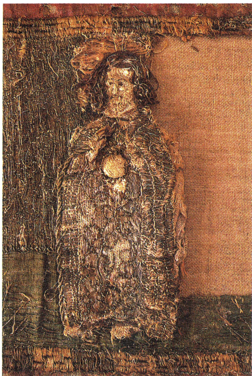
Bild 2. Senmedeltida broderat altarbrun i Björklinge kyrka. Fragmentariskt. Detalj med Kristus.