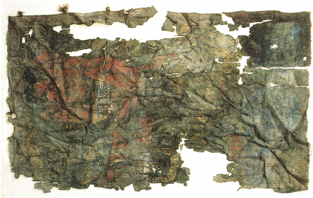
Bild 8. Senmedeltida processionsfana av mörkblå linnelärft med dubbelsidigt måleri. Fragmentarisk. På denna sida en framställning av Pingstundret. Jämför bild 10. Björklinge kyrka.

fyllning är av sammanpressade små bitar av ett parkumliknande tyg.