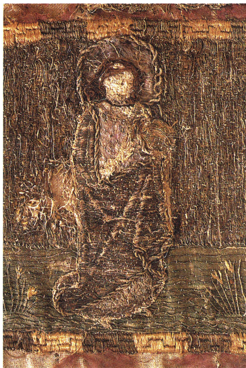
Bild 5. Senmedeltida broderat altarbrun. Detalj med apostel vars attribut ej kan identifieras.

de på rad med jämna avstånd. Figureorna står på en grön markremsa, som löper längs altarbrunets hela längd innanför den smala bården av en vinranka. Tydliga märken visar var figureorna ursprungligen stod, bl a är fötterna i många fall bevarade. Mellan figureorna på den gröna markremsan ser vi blomstertuvor. Bakgrunden, mot vilken figureorna avtecknar sig är nu gråaktig men var ursprungligen gyllene. Figureorna bär nu gråaktiga mantlar, ursprung-