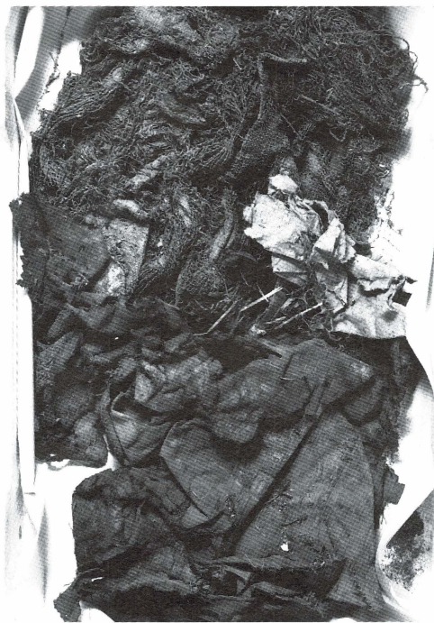
Bild 1. Textilfragment funna under altaret i Björklinge kyrka vid restaureringen 1989. Före konserveringen. Nederst ses den hopknycklade processionsfanan, överst bl a delar av det broderade altarbrunet.

I samband med Björklinge kyrkas restaurering under slutet av 1980-talet påträffades diverse fragment i ett utrymme under altaret, 1 bl a bitar av polykromt glas från ett 1600-talsfönster, några ornament från krönet av ett senmedeltida altarskåp, ett berett pälskinn av grävling 2 samt ett antal textilfragment som bestod av hopknycklade spröda och svårt skadade textilstycken bemängda med sand och damm. Bild 1. Redan vid den första besiktningen i kyrkan 1989 kunde rester av broderi iakttagas på några av fragmenten, spår av målning på ett annat fragment. Samtliga fragment överfördes till Riksantikvarieämbetets dåvarande textilenhet för undersökning och eventuell konservering. De fuktades försiktigt ut och rengjordes från sanden under noggrant iakttagande så att ingen information skulle gå förlorad. Konserveringen och den vetenskapliga undersökningen utfördes parallellt. 3 Det följande utgör en redogörelse för textiliernas nuvarande tillstånd men även ett försök att beskriva deras ursprungligen praktfulla utseende.