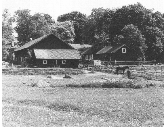
Ekonomibyggnaderna från väster.