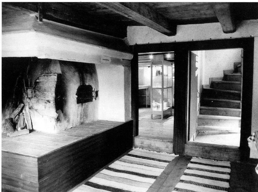
Interiör från köket mot förstuga och kammare.