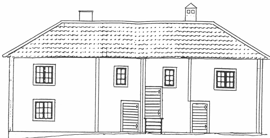
Södra fasaden. Uppmåtningsritning från Upplandsmuseet 1986.