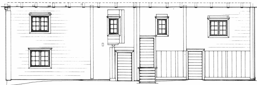
Södra fasaden efter borttagande av fasadputsen 1986. Tydligt syns de igensättningar som gjordes vid återställandet 1938. Uppmåtningsritning från Upplandsmuseet 1986.

att den tillbyggnad som Linné gjort från början varit rödfärgad, i varje fall i övervåningen.