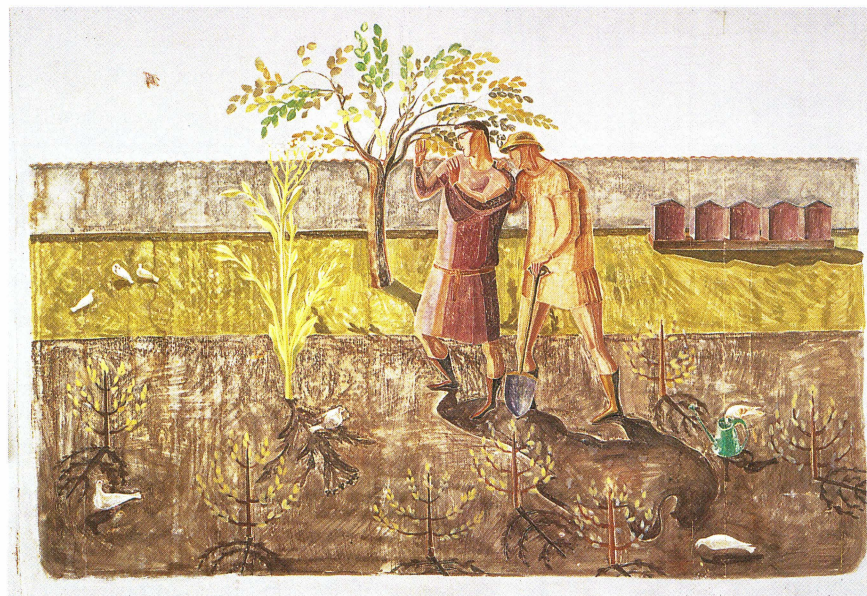
Senapskornet. Tempera på papper, 1927. Vänge försam- lingshem.