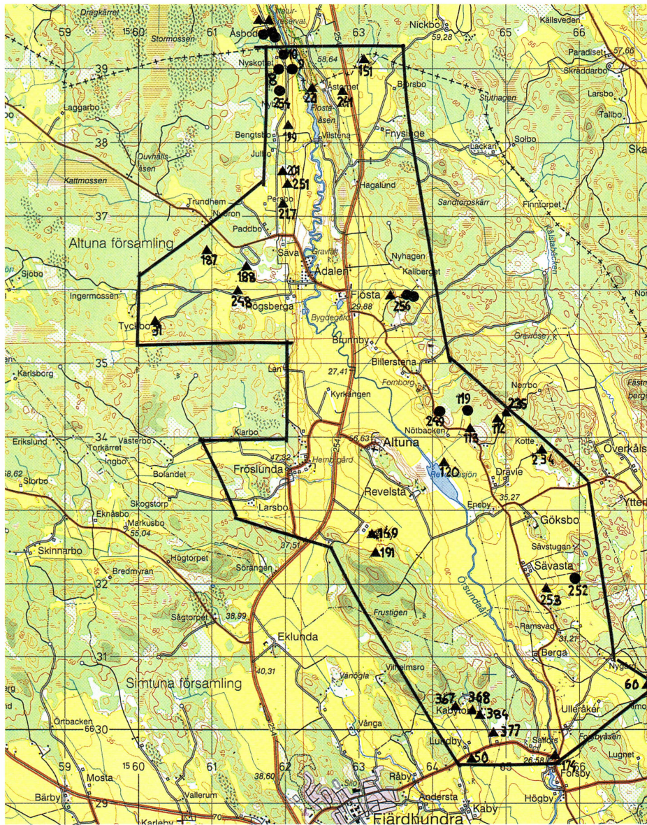
Utdrag ur topografiska kartan Enköping 11H NV. ● = boplats, ▲ = fyndplats. Skala 1:50.000.