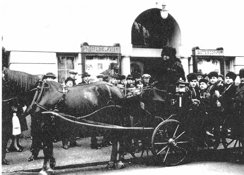
Slottsbiografens exteriör. Eventuellt är fotografiet från invigningen i oktober 1914.

Det ornamentala har komponerats och utförts av bröderna Lindgren i Uppsala, den figurliga delen – hantverkarbilderna i fyllningarna – härrör åter från Gusten Widerbäck.