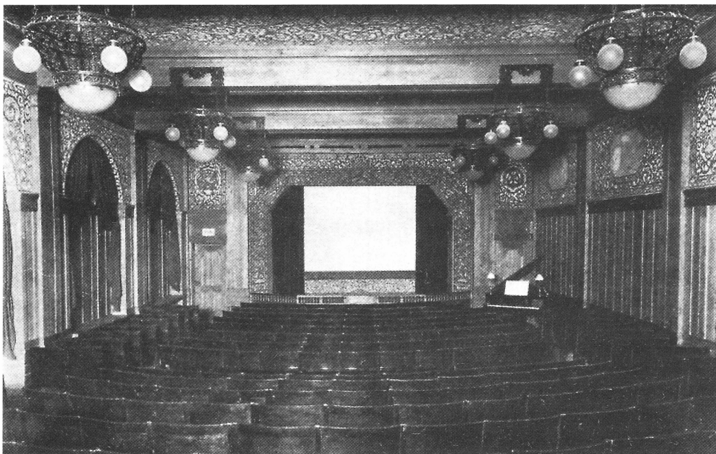
Salongen vid tiden för invigningen i oktober 1914.

maskinrum. Samlingssalen var från början tänkt att användas för verksamheter i huvudsak kopplade till Hantverksföreningens intressen. Men redan under byggnadstiden skrevs ett hyreskontrakt med en av Sveriges dåtida stora filmkämpar, Hugo Plengiér. Därefter kom planerna, vare sig man önskade det eller inte inom föreningen, att mera inriktas på biografverksamheten. För att erhålla flera möjligheter att använda lokalen togs en lucka upp i golvet så att biografstolarna vid behov kunde tas