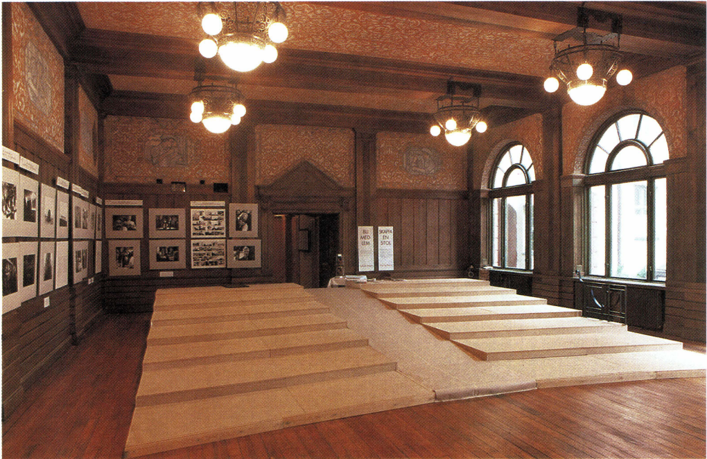
Det upphöjda golvet i salongens bakre del. Fortfarande återstår monteringen av räcken och stolar.

med det dekorativa måleriet. Muralmålningarna tvättades, kompletterades och bättrades av konservatorerna.