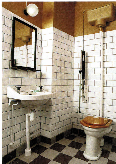
Den nyinstallerade handikapptoletten.