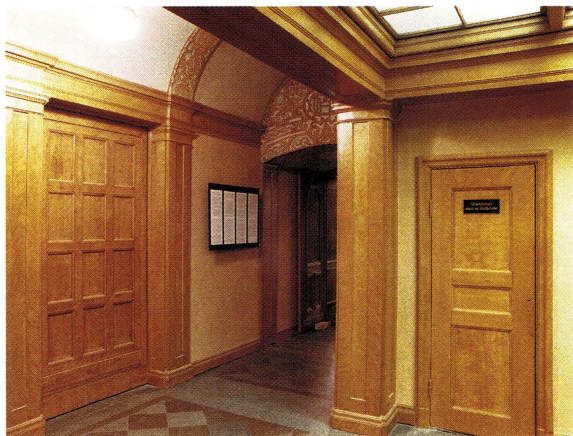
Foajén efter restaureringen.