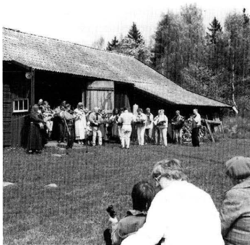
Spelmansstämma vid Tolvmansgården, Rimbo.

Arbetsdag hölls 25 april på Tolvmansgården. Därtill har ett otal arbeten utförts genom enskilda insatser.