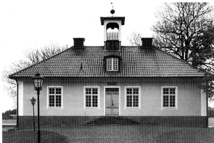
Karleby tingshus.