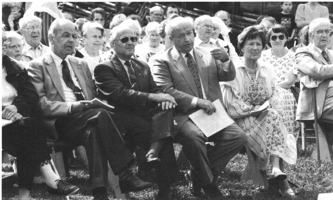
Rasbokils Hembygdsförenings 50-årsjubileum 15 augusti 1993.