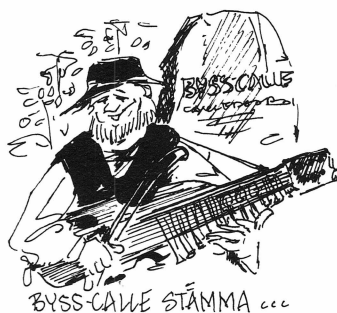
BYSS-CALLE STÄMMA o.c.c.

gården. I Älvkarleö bruk förvaltar föreningen en smedstuga intill Älvkarleö herrgård. Arbetet med bevarande av gårdarna med föremålssamlingarna och årligen återkommande arrangemang har präglat verksamhetsåren 1992–93.