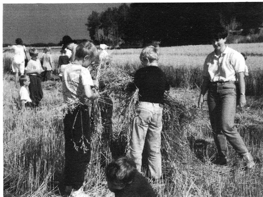
Skolverksamhet under temat »Hur levde barn för 100 år sedan?» Här skördar man havre.

trots regnväder, med gammaldags kämpalekar och ringlekar och tillverkning av vedträdockor.