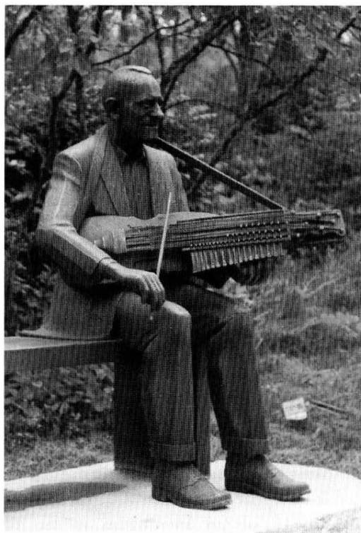
Den nyavtäckta statyn av Eric Sahlström.