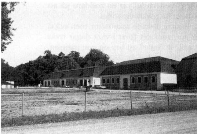
Lövsta bruk. Stall och ridhus. Platsen för midsommarfirandet.

herrar och mamseller så att schaletter halkar ner och svetten lackar.