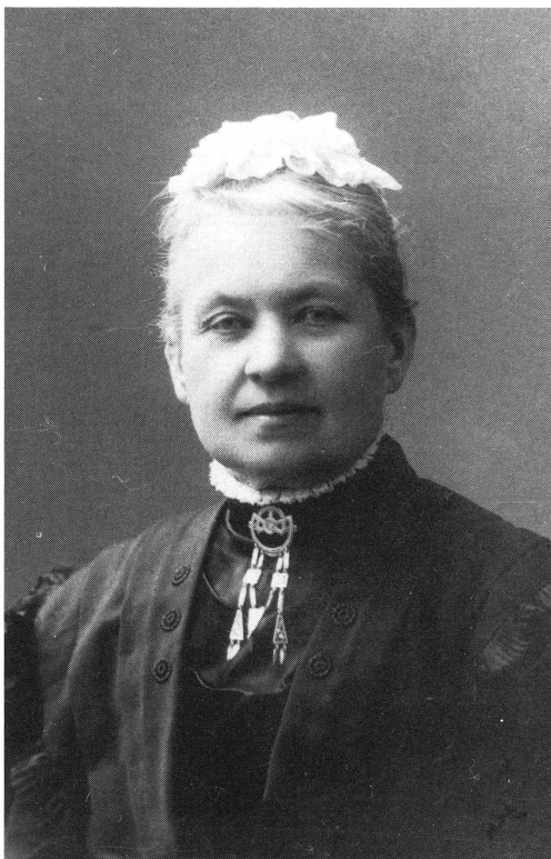
Sigrid Nordlund (1848–1918), signaturen Snorre.

henne med långa artiklar vid hennes 70-årsdag och efter hennes bortgång 1918.