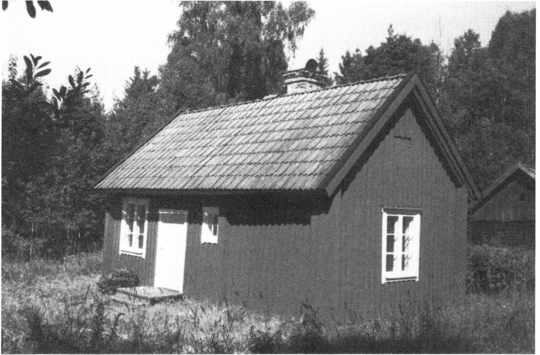
Torpet Vantbacken. Foto Lars-Gösta Hellberg 1991.

också låg "längst vid skogens bryn", bara med den skillnaden att det var längst väster om byn! Båtsmannen hade i nåder fått odla upp lite mark. Tyvärr blev det nästan tre kilometer att bära hem höet.