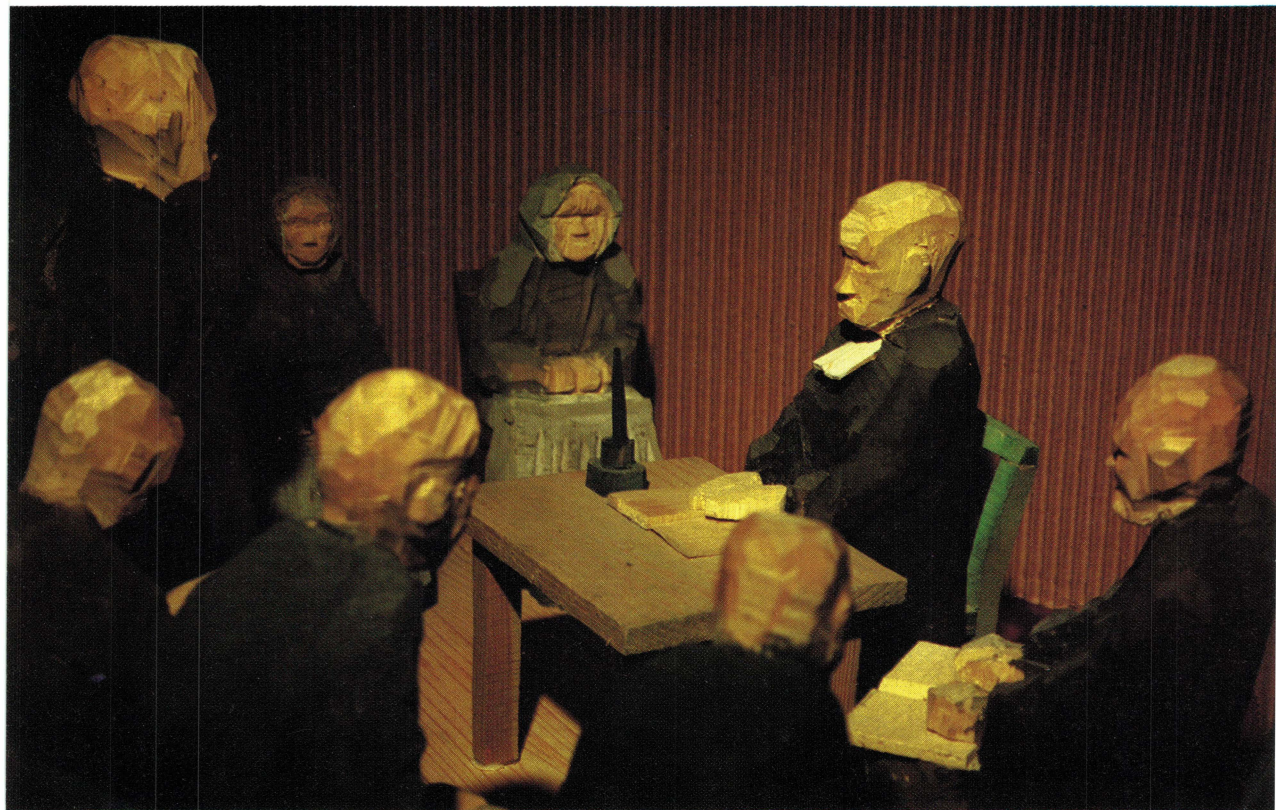
Figurscenen Husförhör av Hans Lustig, Uppsala, förmedlar det stora allvar, den högtidliga stämning och den spända atmosfär som säkert kännetecknade husförhören i äldre tid. Endast prästens krage lyser vit och accentuerar huvudpersonens betydelse i det dunkla rummet där en av rotens medlemmar just är tilltalad, medan de övriga ängsligt kryper ihop och väntar på sin tur.