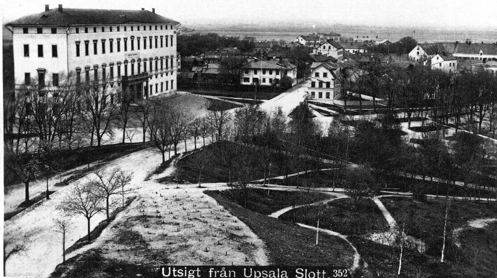
Utsigt från Uppsala Slott. 352

1870-talet, innan Stallgården var 1908 af C. Annerstedt.