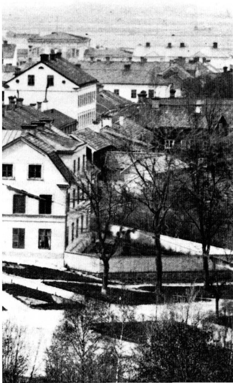
Bild 3. Delförstoring av föregående bild. Framför Stallgården syns det s k Stenhuset i kvarteret Ubbo.