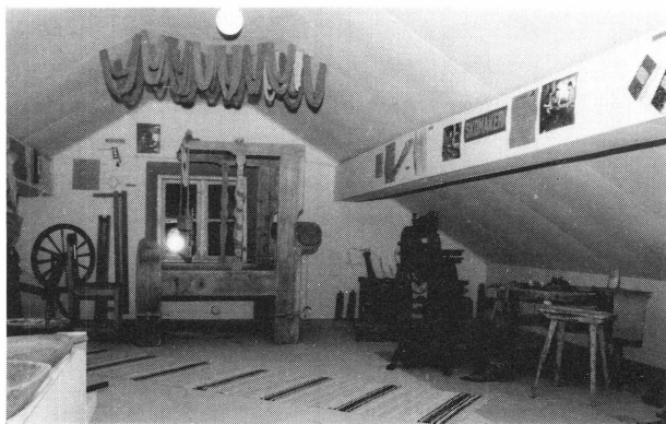
Själastugan och museet

Stugan rymmer en rejäl murad spis, väggfast inredning samt mjölkberedningsföremål.