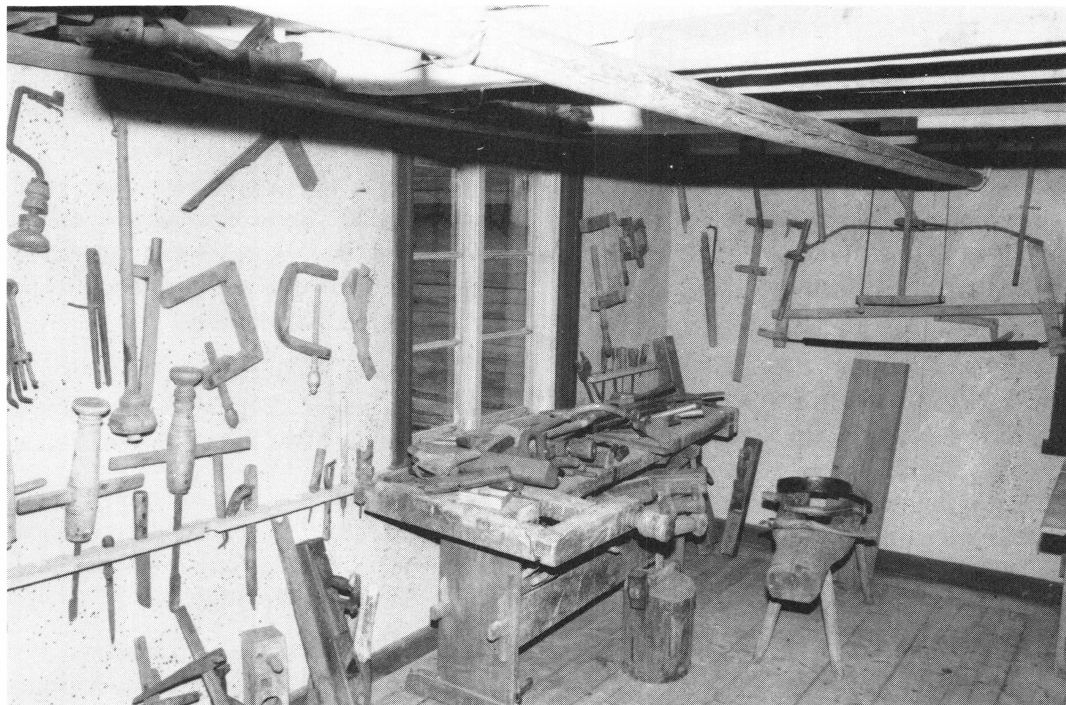
Harbo hembygdsgård med lagningsverkstaden

talet 1668. I mangården, en parstuga från 1700-talet, finns intresanta väggmålningar och utrymme för möten och sammankomster. Brygghuset i portliderlängan inrymmer en mindre föremålssamling. Gården visas för intresserade bl a under det traditionella mid-sommarfirandet. Sedan två år tillbaka har man haft ett program kallat Julen förr i tiden, med dukat traditionellt julbord och julmarknad i mangården.