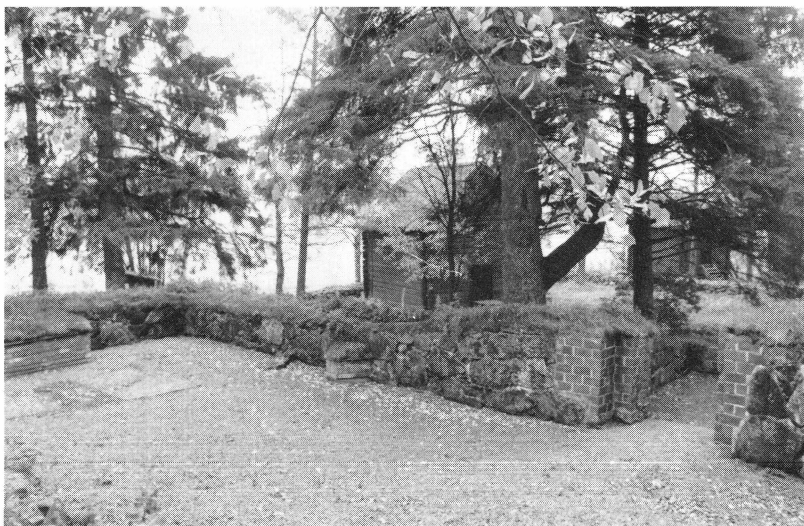
Huddunge kyrkoruin och hembygdsgården

Utöver sedvanlig verksamhet med byggnads- och föremålsvård märks arrangemang som hembygdsdag, midsommarfirande samt brasafton.