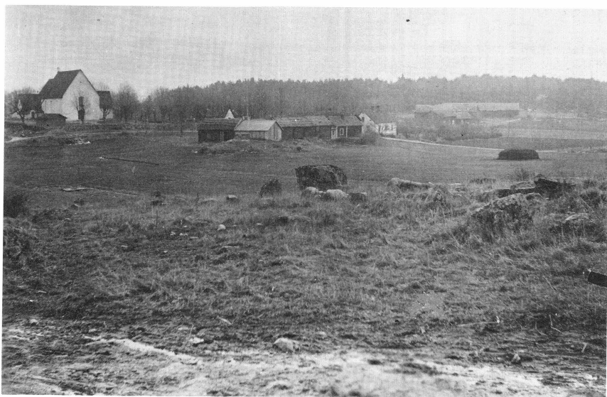
Villberga hembygdssamling. Villberga kyrka på ett gammalt fotografi i den rika Enabygdssamlingen.

Av kommunen har hembygdssamlingen under våren 1987 fått övertaga ansvaret för "Enabygdssamlingen". Den omfattar ett stort lokaldokumentärt material med böcker, skrifter, noter, kartor, foton, inspelningar, m. m. samt ca 70.000 tidningsurklipp. Det dokumenterade området omfattar hela sydvästra Uppland. Samlingen är inrymd i gamla banklokalen i Grillby, där vi även disponerar det brandsäkra valvet.