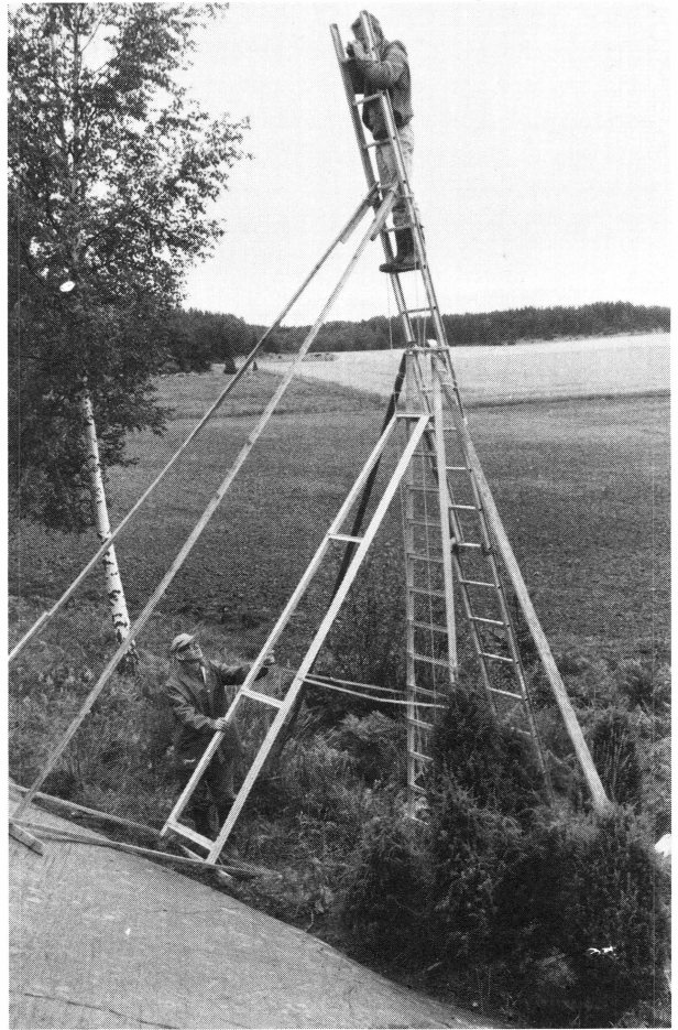
Boglösa hembygdsförening: Brandskogsskeppet fotograferas.

mande nationalitet. En sextonsidig broschyr: Vägvisare till hållristningarna i Boglösa, har under året framtagits av Eva Lindahl och bekostats av Enköpings kommun och Uppsala läns landsting.