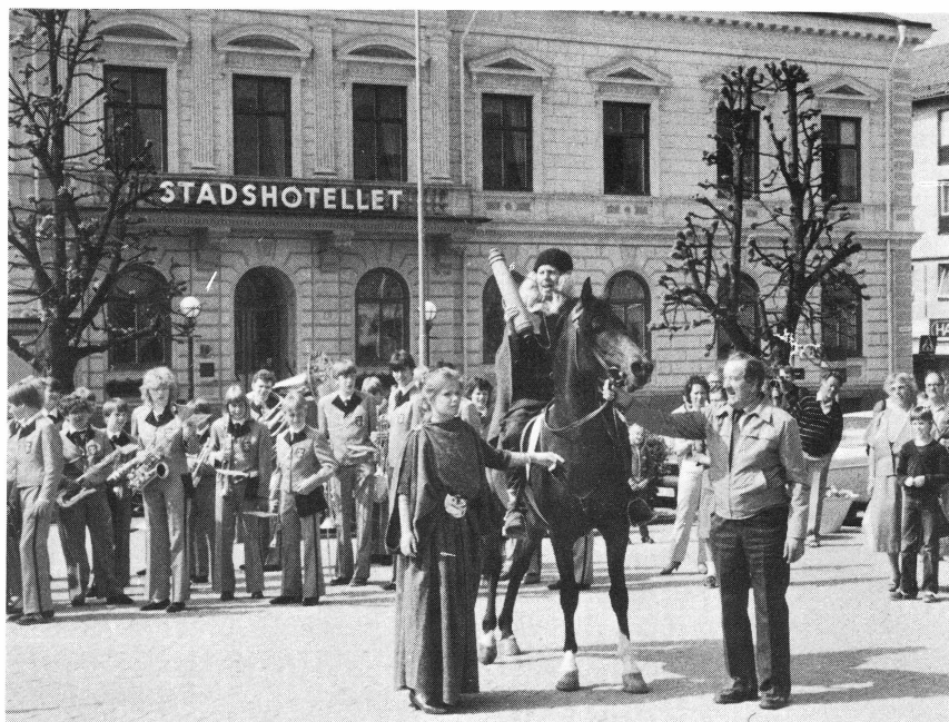
Boglösa hembygdsgörelse. Hembygdens års budkavle anländer från Boglösa till Stora torget i Enköping.

maren var placerad på Djurgårdsmuseet i Eskilstuna, medan den andra tillkom i september i samband med projektet "Uppländsk Resemarknad", där hållristningarna presenterades som utflyktsmål.