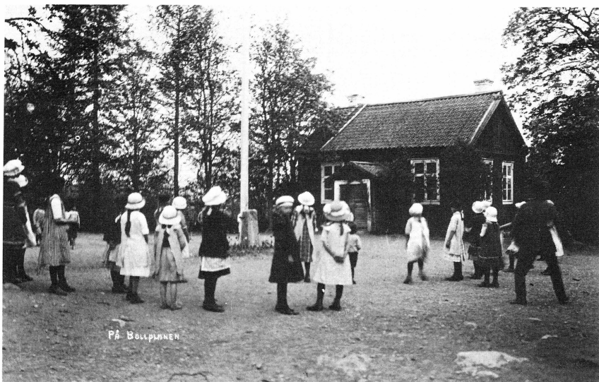
Altuna hembygdsgöreling. Lek på bollplanen framför gamla skolhuset intill hembygdsgården i Frölunda by. Foto John Alinder omkr. 1920.

kommande aktiviteter, bl. a. öppethållande lördagseftermiddagar under sommaren.