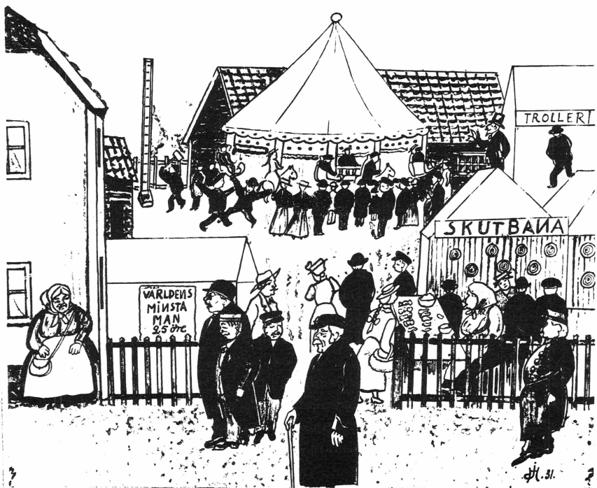
Roslagens Fornminnes- och Hembygdsförening. Marknadsnöje på Appelbergska gården i Norrtälje på 1800-talet. Teckning av Joel Hansson 1931. Appelbergska gården har nu renoverats på ett förtjänstfullt sätt.