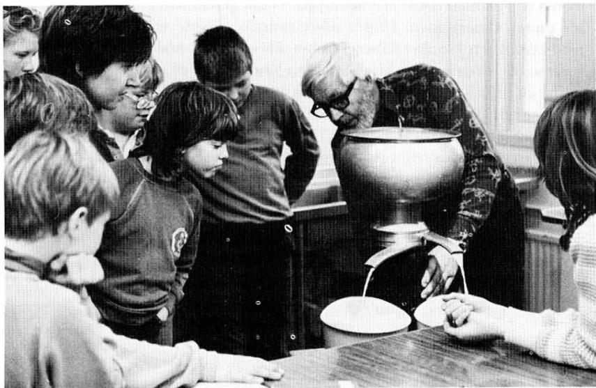
Norrsunda Fornminnes- och hembygdsförening. I samband med hembygdsföreningens skolverksamhet visades bl. a. separering av mjölk.

Den 28 maj var vi värdar vid Vrån för det Nordiska vänortsbesöket. Den 3 juni hade vi besök vid Vrån av pensionärer från Storstreta och vad var lämpligare än att bjuda på en kopp kaffe. Den 4 juni medverkade vi vid socialkontorets personalutflykt till Åshusby.