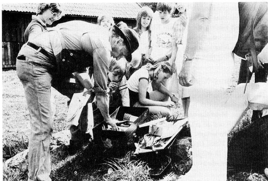
Sollentuna hembygdsförening. Öppet hus för skolorna på hembygdsgården Hersby: gård-farihandlarn kommer.