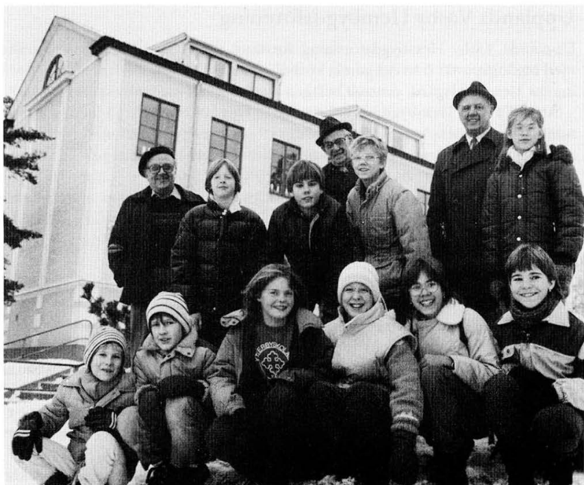
Täby Hembygdssförening. Unga och gamla kan förenas vid studier om en skolas historia. Här utanför Ytterbyskolan i Täby.

det varit för de tio eleverna ur årskurs sex, som skrivit en del av sin skolas historia från sekelskiftet till våra dagar och ordnat ett litet skolmuseum. Boken, som heter "Ytterby – skola och samhälle i Täby", har blivit en "bästsäljare", inte minst tack vare de dråpliga intervjuerna med gamla lärare och elever, vaktmästare och baderskor.