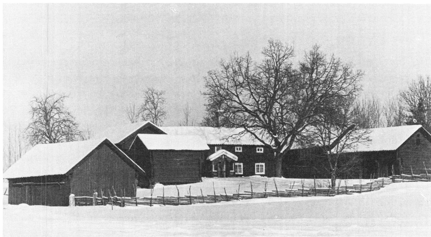
Torstuna hembygdsförening. Härledgården, invigd till hembygdsgård 1951, i vinterskrud.

Alltsedan 1960 hålles traditionsenligt varje midsommarafton fest med majstångsresning, lekar, skämttävlingar, servering m.m. Socknen är nu indelad i sju rotar som i tur och ordning sköter alla arrangemang, t. o. m. bakar kaffebrödet. Tur med vädret och hela gårdsplaten full av folk. Annandag midsommar hölls