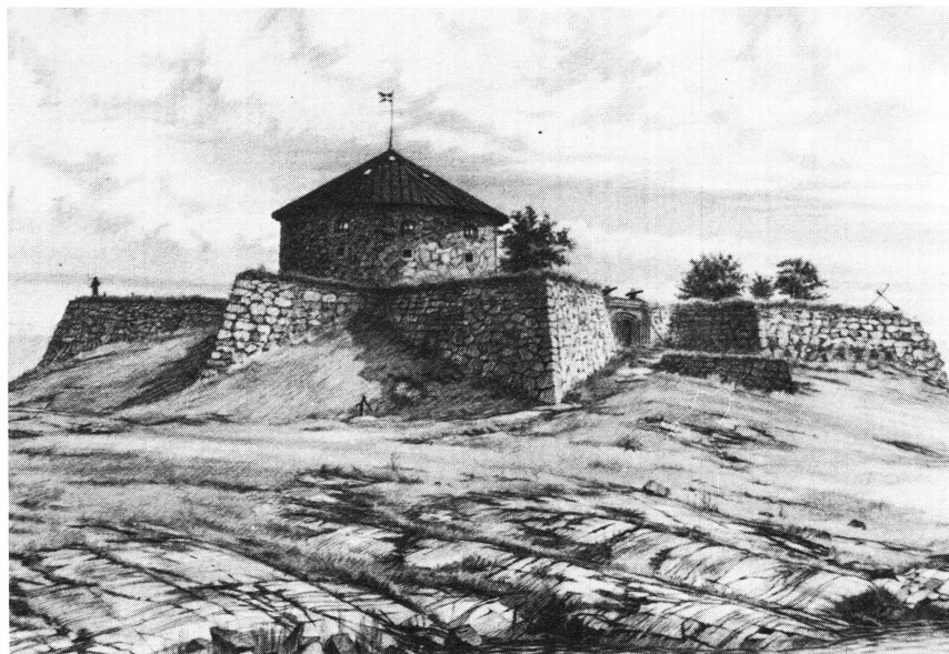
Bild 3. Dalarö skans, färdigbyggt 1659. Teckning i Vaxholms fästnings museum.