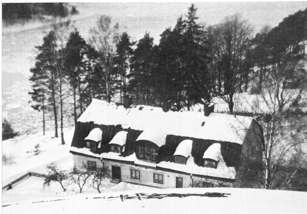
Bild 4. Stenkasernen Värmdö, byggd i slutet av 1750-talet enligt ritningar av Carl Hårleman. Foto vintern 1970.

Stockholm med sin skärgårdsfästning låg inbäddad i centrum av detta väldet. Kanske fästningens största roll under denna epok var då regeringen i mitten av århundradet flydde ut till Vaxholm undan pesten i huvudstaden. Under ett par veckor styrdes Riket från Vaxholm.