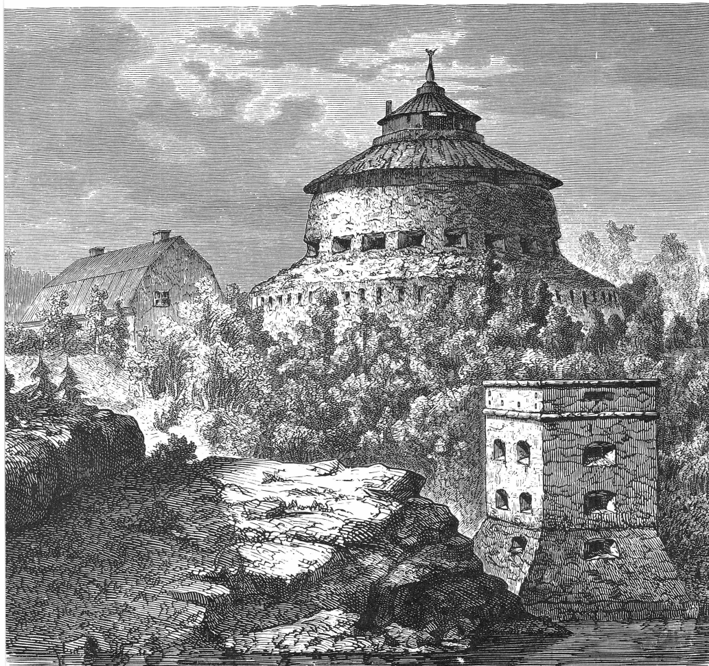
Bild 6. Fredriksborgs fästningstorn med en av kaponjärerna i förgrunden. Teckning av J. Haglund 1867.

Fredriksborgs fästning kom, mer eller mindre symboliskt, att fylla sin uppgift knappt hundra år. En av kaponjärerna, den södra, revs 1838 och redan 1826 hade tornet förvisats till historiens minneslund. Sedan gick förfallet fort. Den översta våningen hade redan börjat rasa och i den ständiga bristens och fattigdomens tvångströja hjälptes förfallet på väg genom att byggnadsmaterial, främst den välisolerande sandstenen togs bort och användes till att kläda murarna invändigt på Vaxholms kastell,