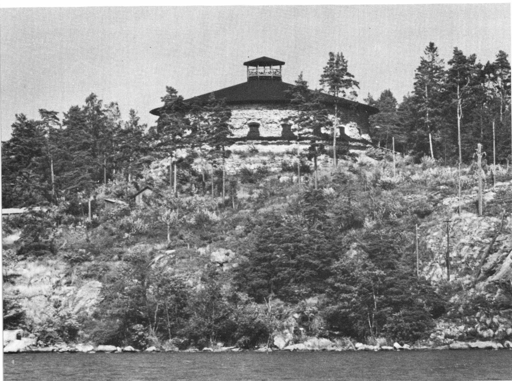
Bild 5. Fredriksborg efter 1840. Foto sommaren 1972.