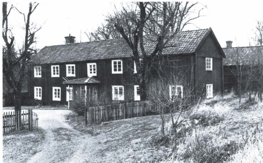
Bild 7. Framkammarsluga med kammare vid bägge gavlarna. Hov, Rasbo socken. Tvåvåninga framkammarslugor har varit ovanliga. Förutom denna finns endast en liknande vid Rasbokils kyrka och en i Morberga, Bälinge socken.