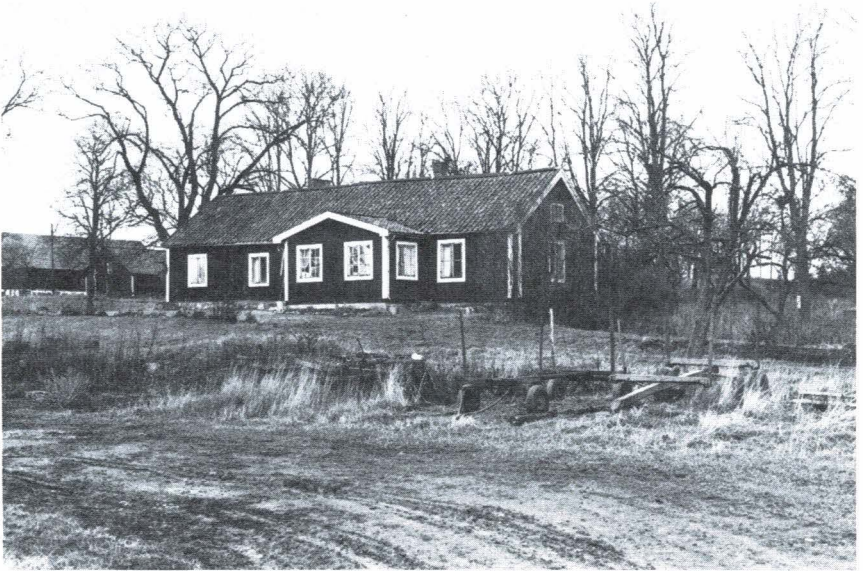
Bild 3. Visteby fänriksboställe tillhörande Rasbo kompani av Upplands regemente. "Caraktärsbyggnaden" uppfördes 1746 och brädfodrades omkring 1800. Verandan har tillbyggt senare.