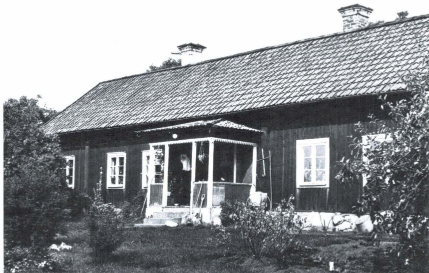
Bild 6. Lejsta, Rasbo socken. Många av de bevarade framkammarslugorna i Rasbo socken finns på gårdar som tillhört Frötuna herrgård.