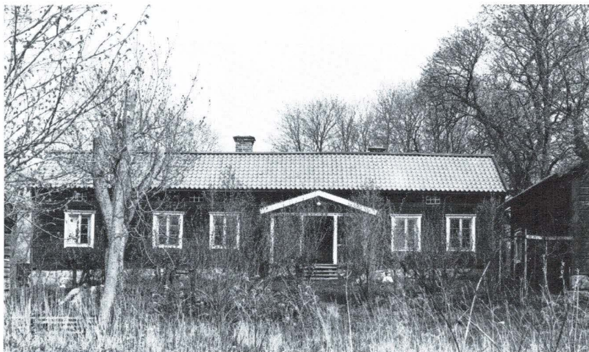
Bild 5. Årby, Lagga socken. Framkammerstuga uppförd i ett sammanhang omkring 1800.

Bostadshusen för de högre militära befälen blev redan under 1700-talets första hälft ersatta av större och modernare bostadshus med sexdelad plan, medan framkammerstugan bibehölls för de lägre befälen. I uppsala trakten finns två boställen med bevarade framkammerstugor från 1700-talet, Fransta i Husby-Långhundra socken och Visteby i Rasbo socken.