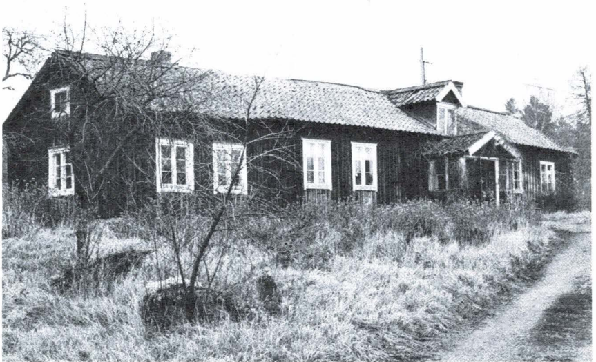
Bild 4. Skåve, Vaksala socken. Bostadshuset utgörs här av en äldre parstuga som i början av 1800-talet tillbyggt med en framkammare invid dagligstugan.