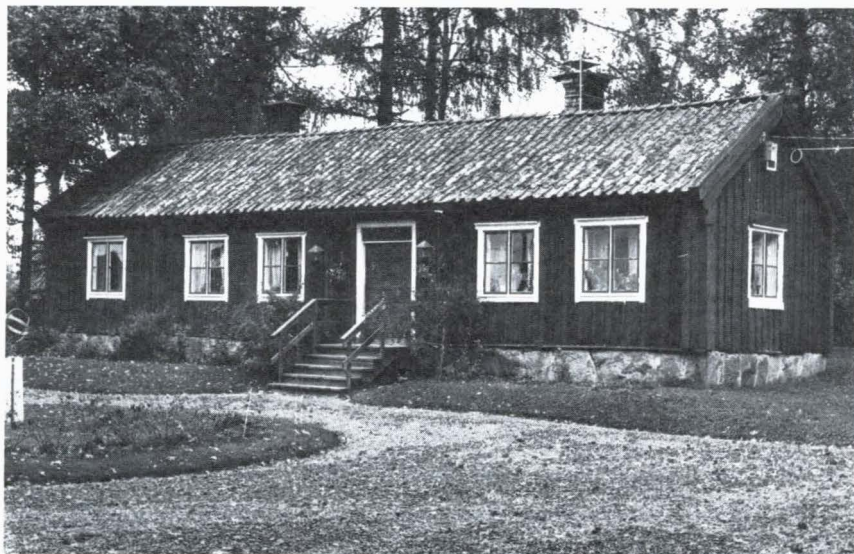
Bild 2. Järsta länsmansboställe, Tensta socken. Byggnaden flyttades till sin nuvarande plats i samband med laga skifte 1844.

kontanter. Vinsterna gjorde det möjligt att uppta nyheter, bostäder utökades, modekläder och kramvaror blev eftertraktade och flera källor talar om en inte obetydlig lyxkonsumtion. I uppsalatrakten tog sig detta bl. a. uttryck i att man förlängde parstugan med en framkammare invid dagligstugan. På enstaka gårdar byggde man även till en framkammare invid anderstugan. Byggnaden kan ha två eller flera murstockar och är antingen uppförd i ett sammanhang eller tillbyggd från parstuga till framkammarstuga. Tvåvåninga parstugor har däremot varit ovanliga och endast förekommit på enstaka storbondegårdar. Anledningen till detta kan ha varit den rådande skogsbristen i slättbygdsocknarna.