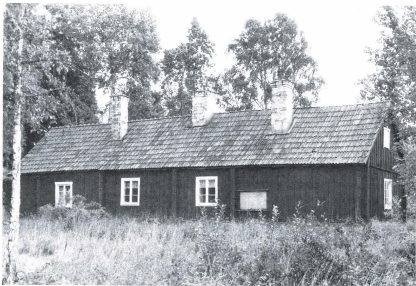
Bild 8. "Tegelbruket" under Älvgärde gård i Rasbo socken. En särskild murstock för framkammaren kan tyda på att den är tillbyggd på en äldre parstuga.

äger alla ett högt kulturhistoriskt värde som representanter för en äldre i dessa trakter mycket vanlig bostadstyp.