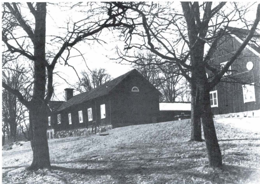
Bild 2. Vattholma värdshus från nordöst. Foto Ivar Lundström 1973.