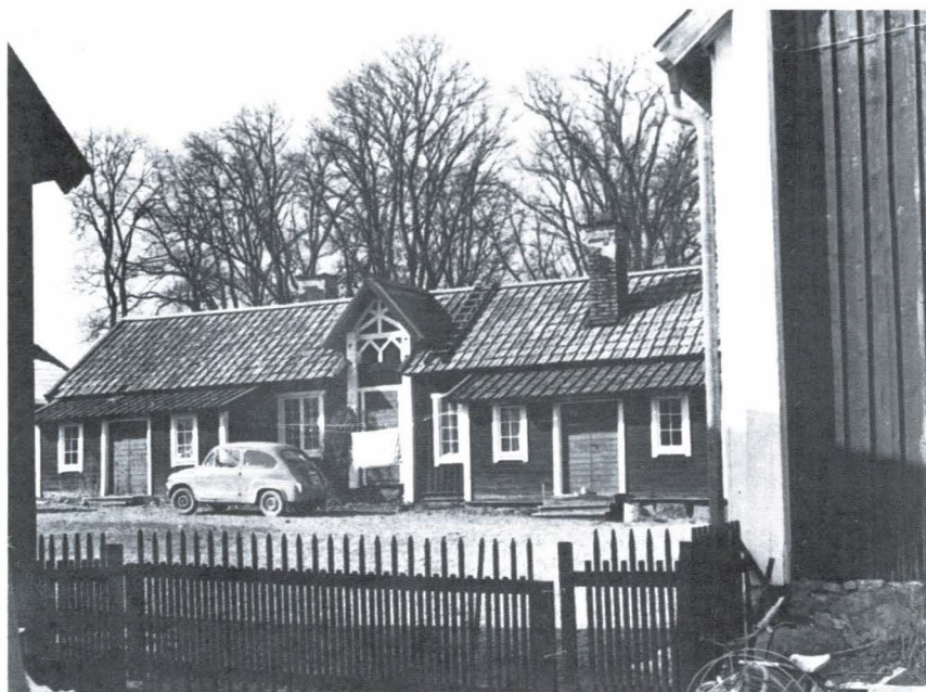
Bild 3. Vattholma värdshus. Parti av den kringbyggda gårdsplanen. Foto Ivar Lundström 1973.