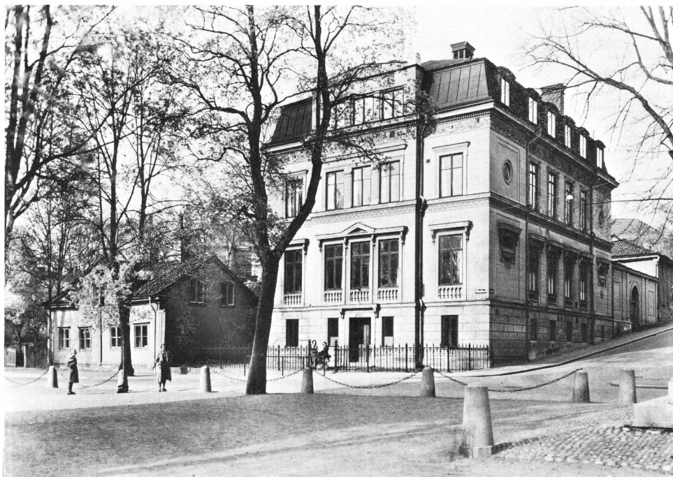
Bild 7. Lindska skolan vid Odinslund i Uppsala. Foto 1940-talet, Upplandsmuseet.

Mimmi var trots sin självständighet inte utan koketteri. Hon bar pince-né, den och det vita håret hon haft sen trettioårsåldern kontrasterade mot den skära, flickaktiga hyn. Kanske kom den sig av hennes dagliga, kalla avrivningar om morgnarna i det utkylda köket.