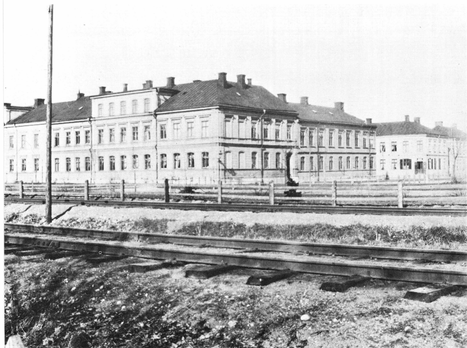
Bild 1. Kvarteret Od, Järnbrogatan 46 i Uppsala. Foto från söder omkr. 1900.

sin dotter Mimmi. Efter moderns död övertog Mimmi den. Hon var, när jag anlände till Uppsala, i femtioårsåldern, inte mycket yngre än min far, men i generationshänseende syssling med mig.