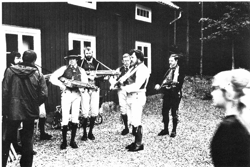
Rasbokils hembygds- och fornminnesförening. Från hembygdsdagen på Kölinge gammelgård.

En nödvändig reparation av Gammelgårdens hus i Kölinge har under år 1980 genomförts. Som skydd för huvudbyggnadens ingångsdörr och tröskel, som tagit skada av infallande regn och snö, har en enkel för trakten i äldre tid typisk och av landsantikvariern godkänd förstukvist med fasta bänkar byggts. Likaså har det gamla Roosens soldattorp fått ny brädfodring på södra gaveln och på nedre delen av den främre långväggen. Där måste också väggstockarna, som skadats av myrangrepp, bitvis ersättas med nytt virke. Samtidigt försågs de båda fönstren med nya karmar och bågar av ursprunglig form. Yttertakets rätades upp genom förstärkning av bjälklaget på vinden och teglet lades om. Slutligen rödfärgades torpet och fönsterbågar, karmar och foder vitmålades på ursprungligt sätt. Allt arbete utfördes av hembygdsföreningens egna krafter och bekostades med medel, som insamlats genom ett par års gåvor och auktioner.