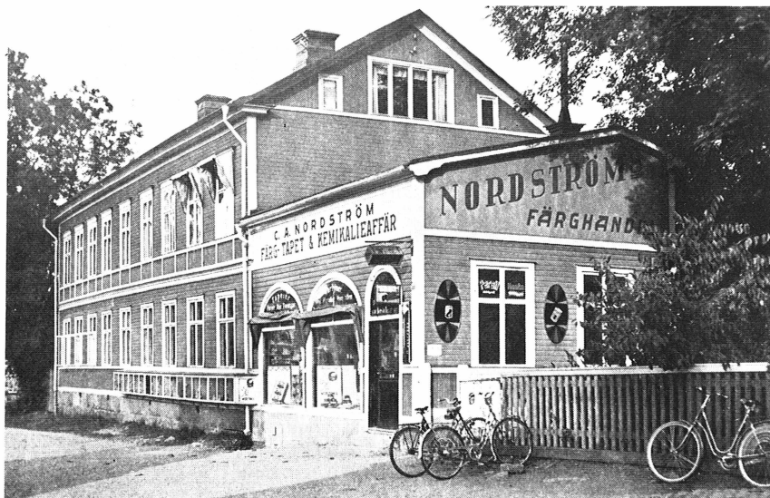
Bild 1. C. A. Nordströms färghandel vid Strömngatan i Norrtälje. Foto 1942.

Rörelsen växte. När Torsten var tjugo år, byggde han till huset med något alldeles nytt. Under besök i Stockholm hade han imponerats av den stora ljusgården på Nordiska Kompaniet och en sådan, om än i mycket mindre format, uppförde han. I den nya lokalen, en trappa över affären och med ljus från taket, kunde han visa varorna på ett helt nytt sätt. Här hade man också juls skyltningen, en stor händelse i den lilla stadens liv.