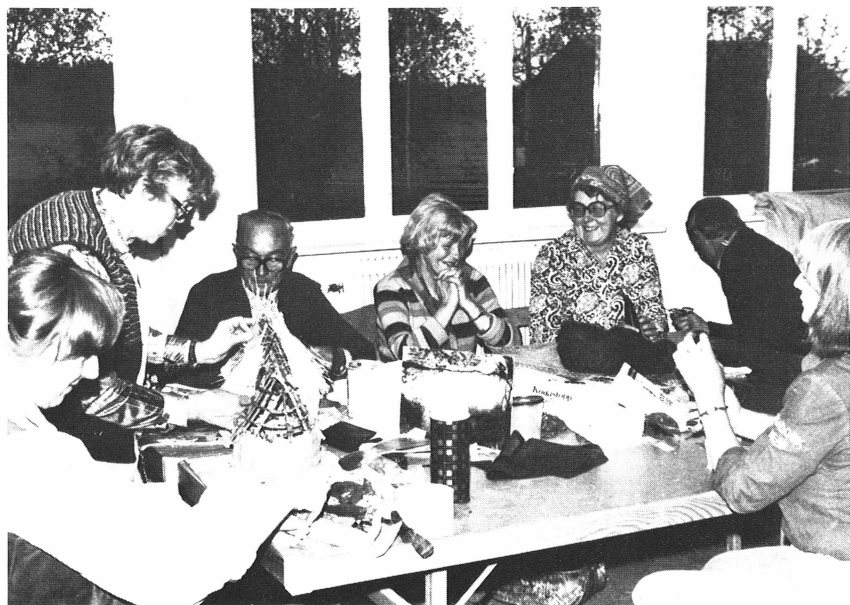
Boglösa hembygd fören. En grupp medlemmar i färd med att göra ett bronsålderslandskap, vilket intar en central plats i Hällristningsgården.