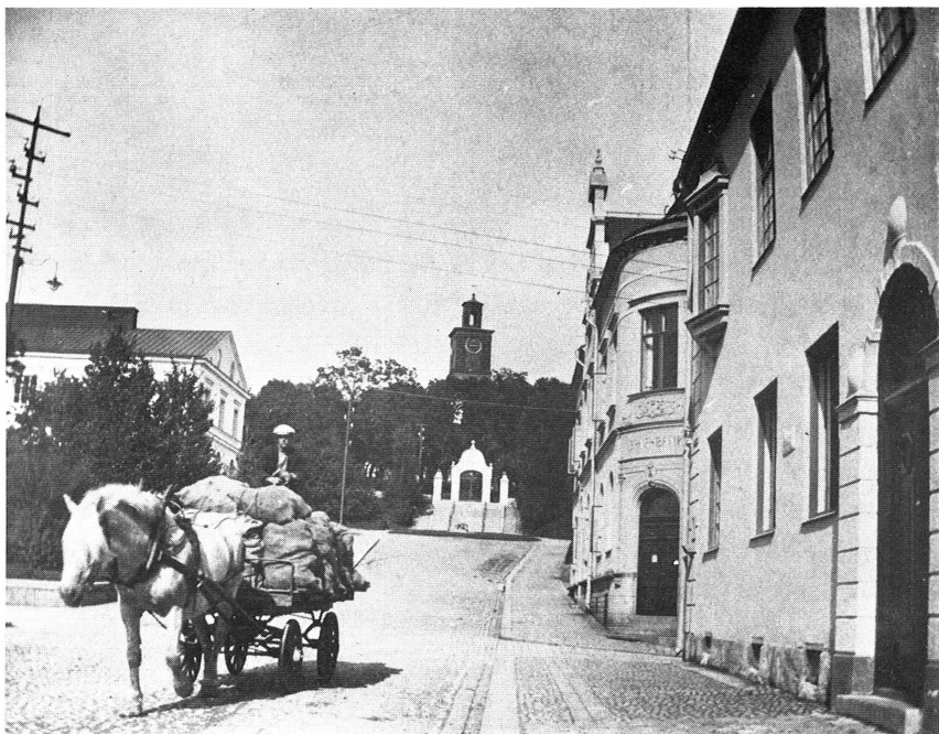
Bild 4. Kyrkogatan i Enköping. Foto A. Schagerström 1920. Upplandsmuseet.

ping. Han gick och rökte med cyanväte. Då tog dom ju slut. Han gick in och rökte men hade aldrig någon mask på sig, han höll andan. Det var riskabelt men han klarade sig. När vi byggde till fattighuset då var han där och rökte med cyanväte. Jag stod där och putsade på ett ställe. Han gick in oskyddad.