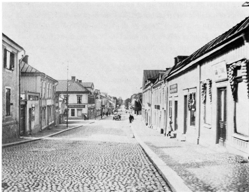
Bild 5. Kungsgatan i Enköping mot sydväst. 1925.

son men han kallas för "var-åttonde-dag." Han är väl 92 eller 93 nu. Han var en sådan där gårdfarihandlare och drog på så länge han orkade. Han hade en cykel med unika på. Han sålde lite kängremmar och tvålar och sådant där. Lite korta varor som man brukar säga. Han kom precis en gång i veckan till varje familj ute på landet. Därför fick han heta "var-åttonde-dag". Det får han heta än idag.