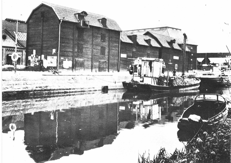
Bild 7. Hamnen i Enköping med de timrade hamnmagasinen. 1940talet.

flammation. Ett annat år gick jag inte stort mer än styvt en halv termin i skolan. Då fick jag sitta kvar ett år för det.