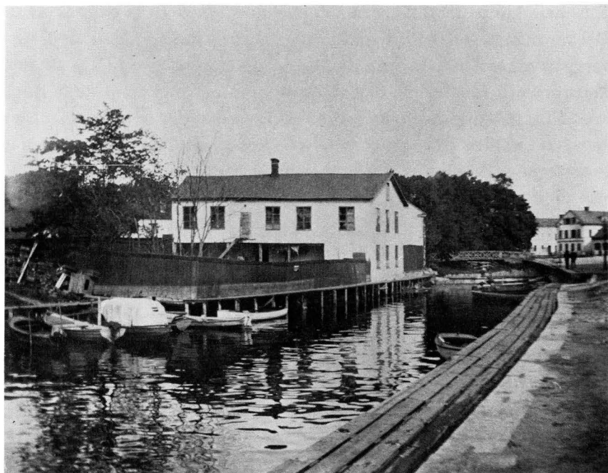
Bild 6. Hamnen i Enköping med garveriet på Munksundet. Foto A. Schagerström 1925. Upplandsmuseet.

opp honom heller, för han skulle göra nytta. Han skulle sopa gatan. Sta'n hade en del gator att sopa. Annars fick varje gårdsägare sopa utanför sitt hus. Jag har också gått och sopat. När jag var ung och vi var nygifta. 1918 var det ont om jobb. Det fanns inte arbete att få tag i på något vis. Jag var ju murare och hade hela vintrarna lediga. Vi hade inte jobb mer än möjligen från maj månad och till oktober, kanske en bit in i november. Sedan fick vi gå arbetslösa hela vintern. Så hade murarna det förr. Vi var sju murare i staden i många, många år. Vi fick gå lediga hela vintrarna. Då fick man jobba med det som fanns. Dom annonserade i Enköpings-Posten att dom ville ha en renhållningsarbetare. Enköpings-Posten ägde ända från Kekonius till stadshotellet. Jag gick dit och fick jobbet. Det var 30 kronor i månadslön. Jag sopade gatan där i 3 1/2 år. Det var kullersten överallt då och hästskiten fastnade mellan stenarna. Den fick man peta upp.