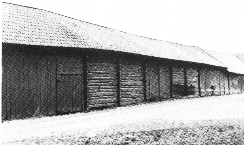
Boglösa hembygdsförening. Från bygatan i den oskiftade radbyn Utmyrby i Boglösa socken. Under medverkan av hembygdsföreningen har den mitre ladubyggnaden restaurerats.

ningen från markägaren som är Enköpings kyrkliga samfällighet. En upprustning hade av Byggnadsfirman Anders Diös AB hösten 1975 uppskattats till 70.000 kronor.