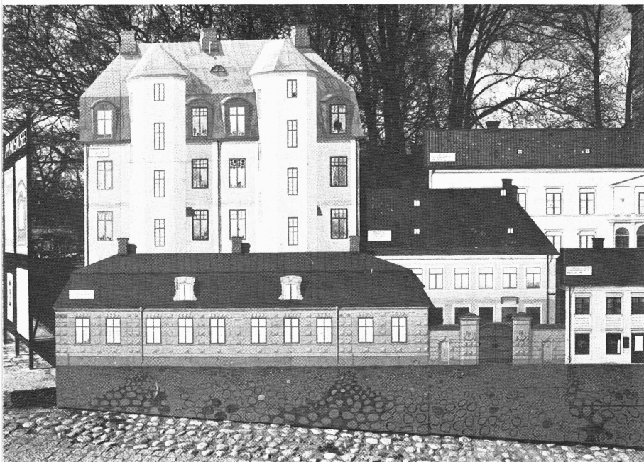
Utställningen Låt husen leva! på bron utanför museet. Foto Kerstin Berg, 1975.