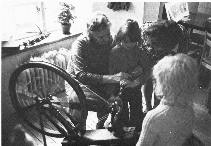
Försöksverksamhet med textilverkstad för barn på Upplandsmuseet hösten 1975.