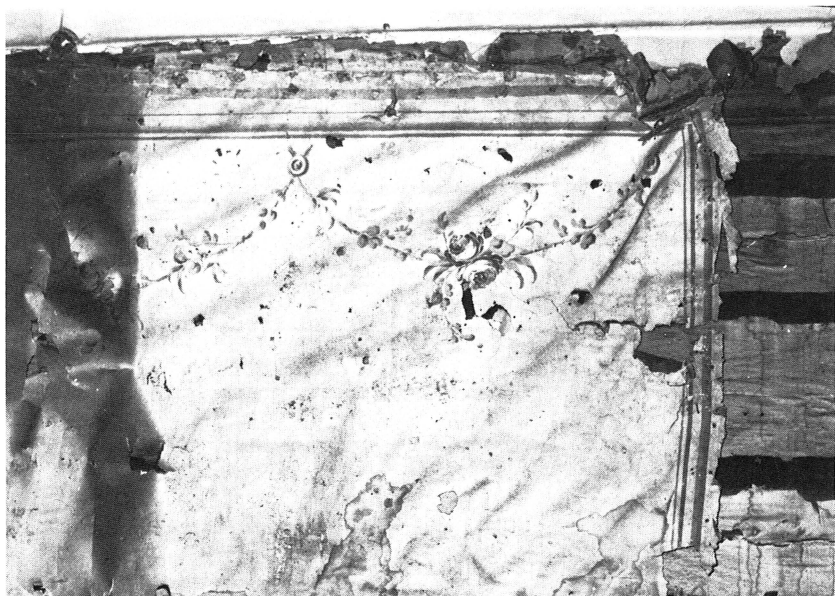
Kvarteret Atle nr 19, Kungsängsgatan 26, Uppsala. I samband med rivningen påträffades i ett av vindsrummen i huvudbyggnaden från 1782 en handmålade, fältindelade tapet, sannolikt från husets första byggnadstid. Foto Lars Gezelius 1975.

byggnad av Kvallsta gård, Östuna sn, samt kulturhistorisk värdering av torpet Johansbo vid Sävja, Danmarks sn, gamla kyrkskolan, Östuna sn, den gamla Uppsala-Enköpingsvägen, delen vid Läby med gamla stenvalvbron och Gustav Vasamonumentet, Läby sn, och bebyggelsen vid Vallskoga gård, Tolfta sn.