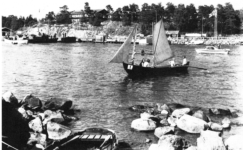
Postrodden 1974. Den vinnande singöbåten vid Postrodden 15 juni 1974.

postrodden. Att resorna mellan de båda socknarna Väddö och Eckerö har medeltida anor, det bevisar namnet Sancte Signille skär, vilket nämnes av Gustaf I, som ville ha en gästgivare på Signilsskär. En kobbe invid detta skär heter Helleman eller Heligman. Därav kan man förstå, att det var en from man, kanske en munk, som stod de resande till tjänst där omkring. Det är ingen romantik i namnet. Färderna över det oroliga sundet var minst av allt romantiska. Men rodden den 15 juni 1974 blev en härlig solskensfärd för de allra flesta. Det blev en strålande roslagsdag för väddöborna med flera på vår sida och en lika fin ålandsdag för eckeröborna och deras grannsocknare på den andra sidan och ett glatt möte mellan de båda hembygdsföreningarna Roslagens sjöfartsminnesförening och Eckerö hembygdsförening, de båda föreningar som stod för arrangemangen. Postverken på båda sidor ådagalade sitt intresse och tillmötesgående på flera sätt, särskilt genom att prägla poststämplor för den minnesvärda dagen. Dessa stämplor kom till användning på försändelser över havet från båda sidor. Dessa kort blev av stort intresse för filatelister på ömse sidor om riksgränsen.