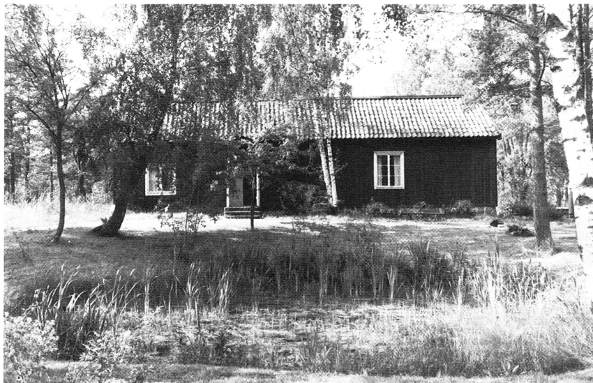
Frösåkers härads hembygdsförening. Tingshuset från 1835 på hembygdsgården i Östhammar.