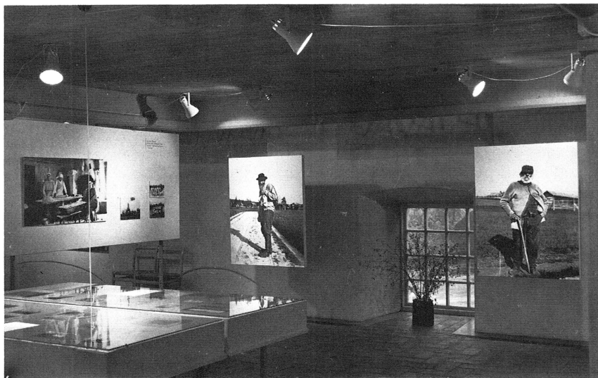
Utställningen Lima, fotografier från Lima, Dalarna 1885–1930.