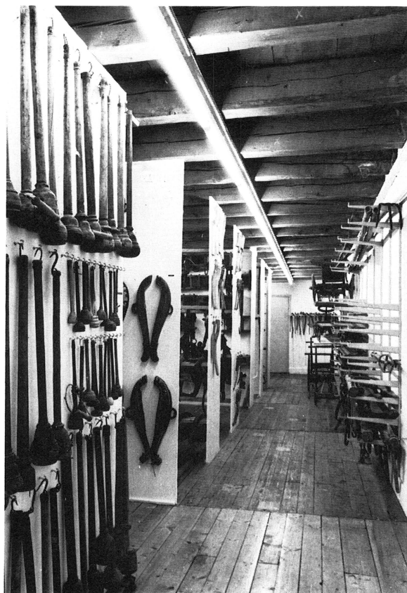
Upplandsmuseets föremålsarkiv. I de nya rymliga lokalerna blir samlingarna överskådliga och lättillgängliga.

samband med schaktningar inför nybygge på tomten Dragarbrunnsgatan 23 i kv. S:t Per. Postum gåva av fröken Elsa Didner, Uppsala.