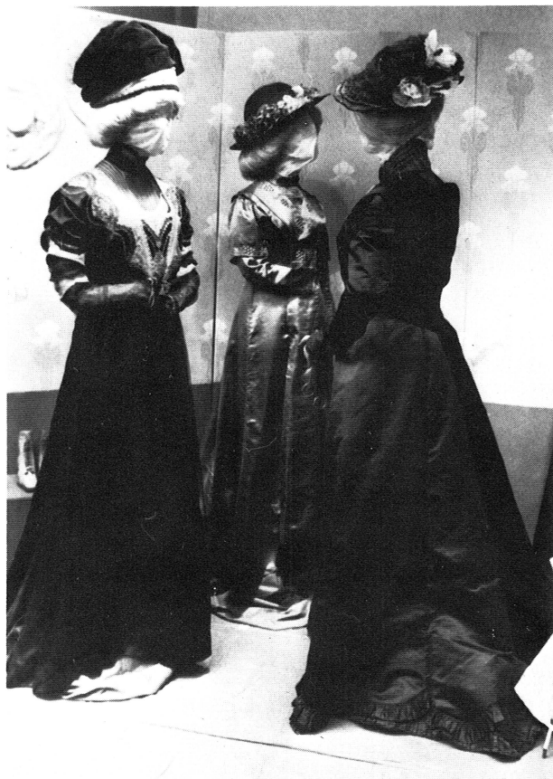
Utställningen Kläder förr, kläder från tre sekler ur Upplandsmuseets samlingar. Här ett utsnitt ur montern Jugend.