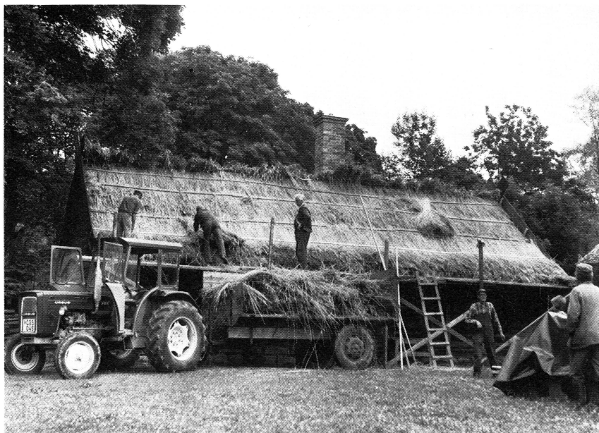
Under sommaren 1974 lades nytt halmtak på bostadshuset vid mor Lottas gård i Kvek i Fröslunda socken. Varje moment i arbetet dokumenterades genom fotografering. Foto K. Wretin 1974.

tidigare påbörjade restaureringsarbetena på herrgården fortsatt. Arbetena detta år har gällt interiören. En yttre restaurering av norra slottsflygeln vid Ekolsund, Husby-Sjutolfts sn, har avslutats. Vid de byggnadshistoriska undersökningar som skedde i samband därmed gjordes några mycket intressanta iakttagelser. Bl. a. blottades detaljer i murverket som tyder på att norra flygeln är betydligt äldre än man tidigare allmänt trott, kanske Johan III:s tid. Vid restaureringen återfick exteriören sin färgsättning från början av 1700-talet, dvs. med en kraftig, »faluröd» färgton i bottenvåningen, gula fasadliv och vita lisener och listverk. För restaureringarna vid Österbybruk och Ekolsund, vilka utfördes som beredskapsarbeten, har landsantikvarien varit av riksantikvarieämbetet utsedd kontrollant. Landsantikvarien har också varit kontrollant vid restaurering av objekt inom parken i Forsmarks bruk.