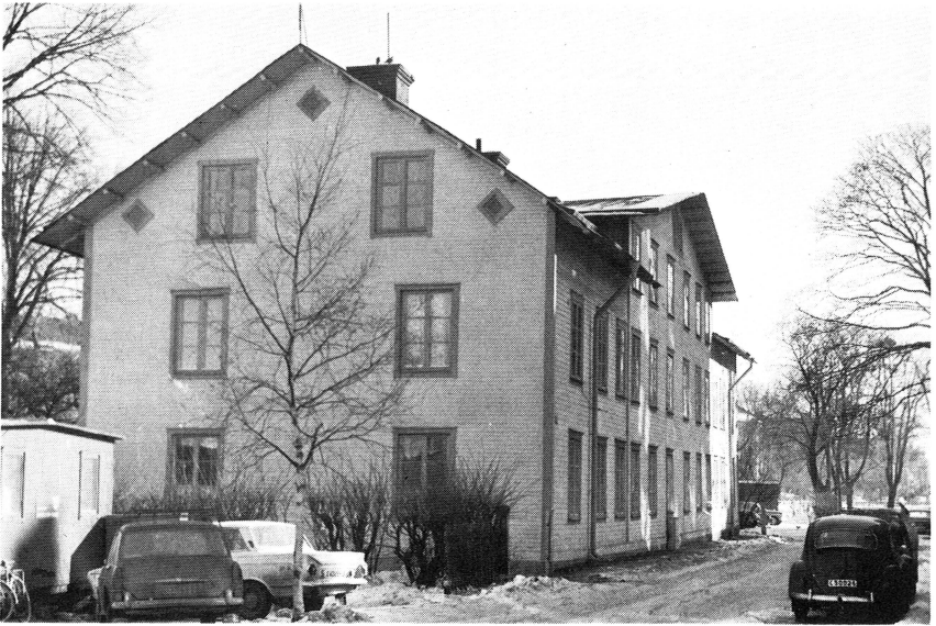
Det sista genuina Luthagshuset av trä vid Fyrisgatan 3 i Uppsala, uppfört på 1870-talet, revs 1974, trots protester från hyresgästerna och trots gårdens stora kulturhistoriska värde. Före rivningen skedde dock en dokumentering av gården. Foto L. Gezelius 1974.

och restaurering av kokhus m. m. i Fågelsundets fiskeläge, Hållnäs sn, samt över förslag till avstyckning av småbåtshamn inom fastigheten Skokloster 2:2 m. fl. vid Skoklosters kyrka.