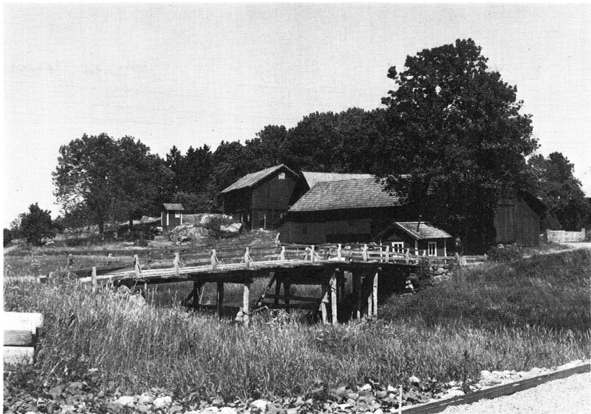
Bild 4. En samlad och »tät» bymiljö finner man i Övernuttö by i Börstil socken. Foto L. Gezelius 1975.

gamla gårdarna, som fick stå kvar, har under 1900-talet genomgått ombyggnation.