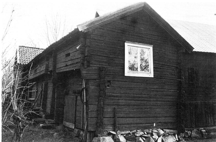
Bild 5. Timrad bod från 1700-talet, Övernuttö by, Börstil socken. Liknande bodar finns på ytterligare några ställen i trakten.

trånga, täta miljö, som finns i t. ex. Ytternuttö. Bägge dessa gårdar har tidigare en tid ägts av Gimo-Österbybruk AB.