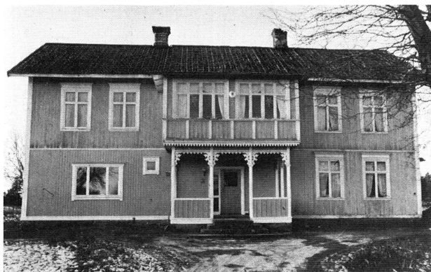
Bild 6. Renovering av äldre hus är nödvändig för att anpassa dem till moderna bekvämlighetskrav. Upprustningen kan dock göras på olika sätt. Vid renoveringen är det viktigt att byggnadens ursprungliga fasad bibehålls. Hånsyn måste tagas till bl. a. fasadmateriäl, färg- och fönstersättning. Ny fönsterstorlek t. ex. bidrar till att fasaden »sprängs sönder».

Logen Riddarborgen grundades 1895, av Johan Andersson i Övernutto. Senare under 1900-talet delades »lokalen» mellan Riddarborgen och missionsföreningen.