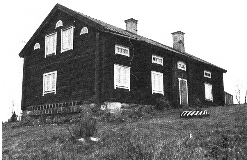
Bild 7. Bostadshus i Borggårde, Hökhuvud socken. Byggnaden tjänade tidigare som arbetarbostad åt Borggårde gård.

största hänsyn tagen till den totala existerande miljön. Om den relativt homogena karaktär, som präglar området, som vi inventerat, skall kunna bibehållas krävs ett samspel mellan befolkning, näringsliv och bebyggelse.