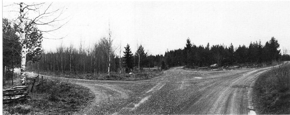
Bild 2. Hela det inventerade området sammanbinds av ett rikt förgrenat vägsystem. Bilden visar en trevägskorsning med vägarna till gårdarna Såggård, Svandal och Nygård, vilka utskiftades från Annö by i Valö socken vid 1800-talets mitt.

byggnadernas ålder, stommaterial, färg, fasadmateriäl, taktäckning m. m. Husen inventerades även interiört. Samtliga byggnader på respektive fastighet fotograferades. En del kompletterande miljöfotografier togs dessutom. Materialet sammanställdes sedan och ordnades socken- och byvis.