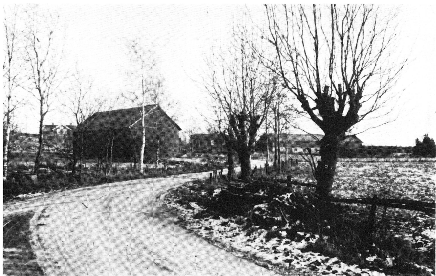
Bild 3. I ett par av de undersökta byarna får »bygatan» en inramning av hamlade träd. Annö by i Valö socken från nordost.

Det som kanske mest präglar området är dess rikt förgrenade vägsystem. Vägarna slingrar sig charmfullt genom landskapet, följer åssträckningar och löper följsamt runt tegar och stenbundna partier av terrängen. Ett vittnesmål om vägsystemets aktningvärdas ålder är förekomsten av runstenar i anslutning till vägarna. En vackert ornerad och välbevarad runsten finns i Sandby, vid en plats som lokalt kallas »Skri-varberget».