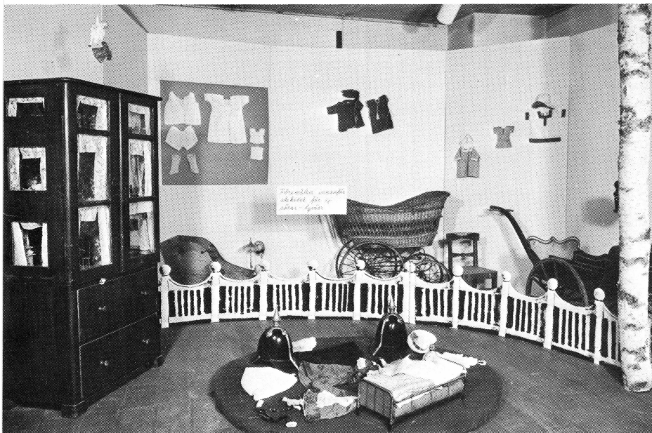
Från utställningen en massa saker från Upplandsmuseets magasin.

I samband med att utställningen öppnades spelade nio uppländska spelmän folkmusik kl. 13–17. Soloframträdande av Erik Sahlström på nyckelharpa. 2 000 personer besökte museet denna dag.