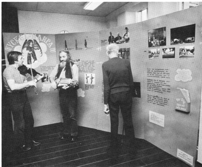
Stockholms läns landstings kulturdelegation visade Upplandsmuseets utställning Nyckelharpan på ett antal långvårdssjukhus.

Verksamheten förlades till Disagården och målsättningen var att genom demonstration levandegöra naturhushållningen i det gamla bondesamhället. Klasserna delades vid ankomsten till Disagården upp i två grupper och genomgick sedan fem »stationer».