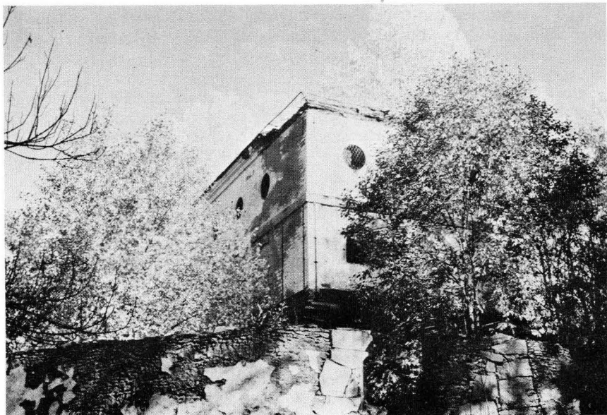
Masugnen och rostugnen vid Bennebols bruk i Bladåkers socken restaurerades 1971–72. Restaureringen utfördes som beredskapsarbete i arbetsmarknadsstyrelsens egen regi. Bilderna visar masugnen före och efter restaureringen. Foto O. Ehn 1971 resp. 1973.