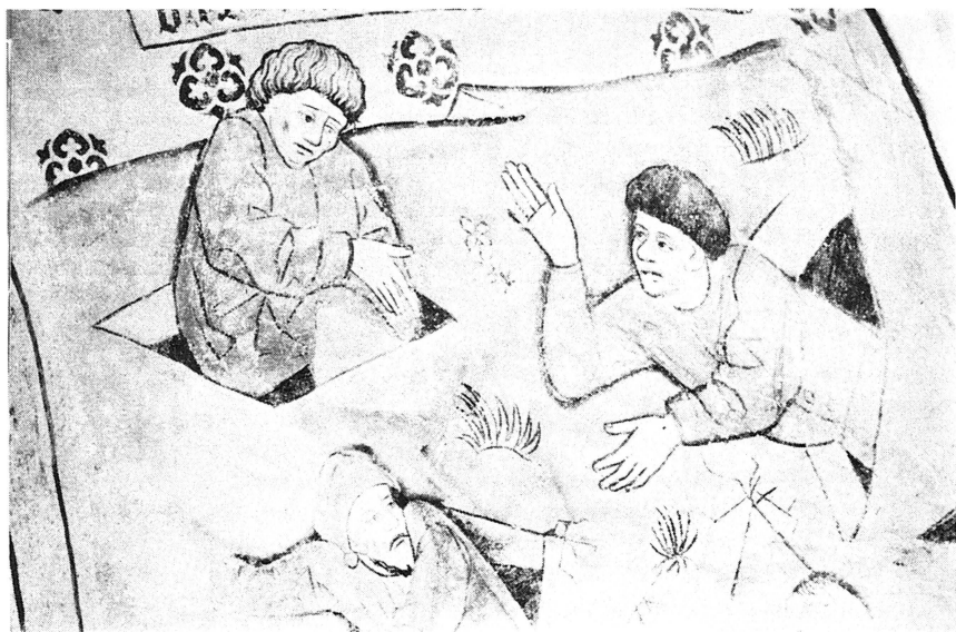
1971–72 genomgick Övergrans kyrka en omfattande inre restaurering under ledning av arkitekt SAR Ove Hidemark, Stockholm. Bl. a. framtog delvis mycket välbevarade senmedeltida kalkmålningar. Dessa anses vara ett av Albertus Pictors första självständiga arbeten. Bilden visar Nionde dagens förebud; människorna går ut ur sina hålor, bestörta av fruktan. Foto O. Ehn 1972.

ren. Under de inre restaureringarna av sakristierna till Vårfrukyrkan i Enköping och Husby Långhundra kyrka har källare påträffats. Källaren i Vårfrukyrkan, som ligger delvis under norra transeptet, hade sekundärt använts som ossuarium. I Husby Långhundra har vidare påträffats en äldre trappa i porten från koret ned i sakristian samt en igensatt, förmodligen romansk portal i kyrkans västvägg.