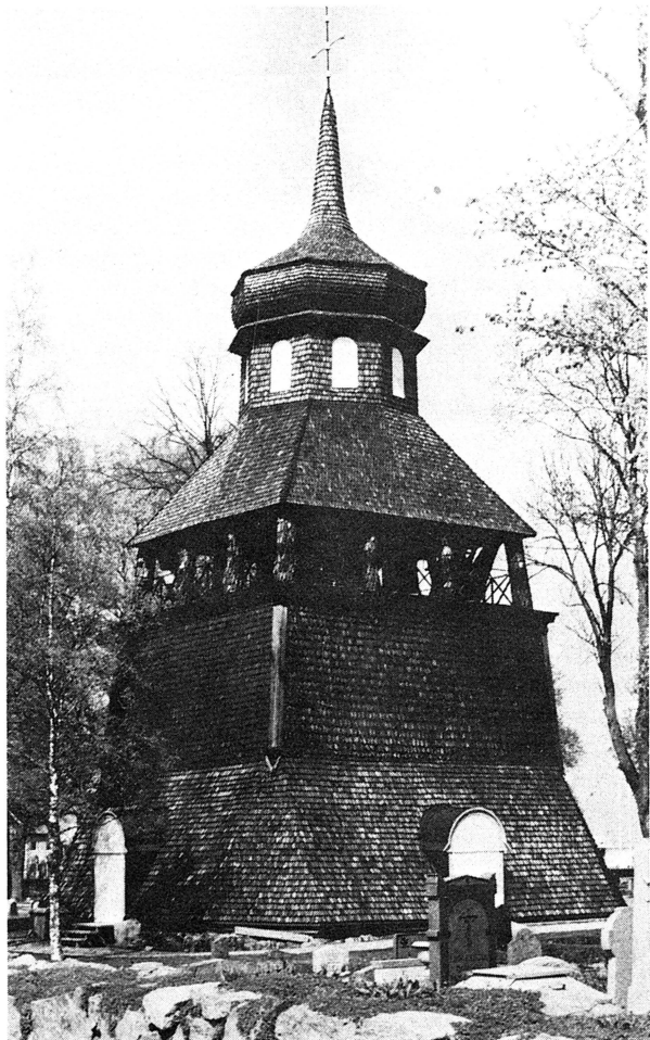
Den mäktiga klockstapel­n från 1706 vid Tierps kyrka restaurerades 1971–72 under ledning av arkitekt SAR Carl-Eric Nohldén, Uppsala. Genom att klockvåningens dominerande trä­räcke från 1800-talets slut togs bort och ersattes med ett enkelt, indraget järn­räcke, återfick stapeln sin ursprungliga resning. Foto O. Ehn 1972.

Kontroller har skett av ledningsschaktningar i Odinslund och stg 736–693 inom kv. Oden samt vid grundundersökningar av byggnaden kv. Rådhuset nr 4 vid Gamla Torget. Ledningsschaktet inom stg 736–693 visade hur åsytan på någon meters djup tämligen väl följer den nuvarande topografien.