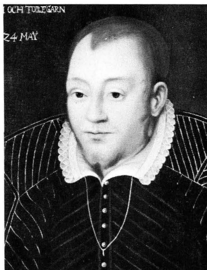
Bild 3. Nils Sture (1543–1567). Detalj av 1600-talskopia. Gripsholm.