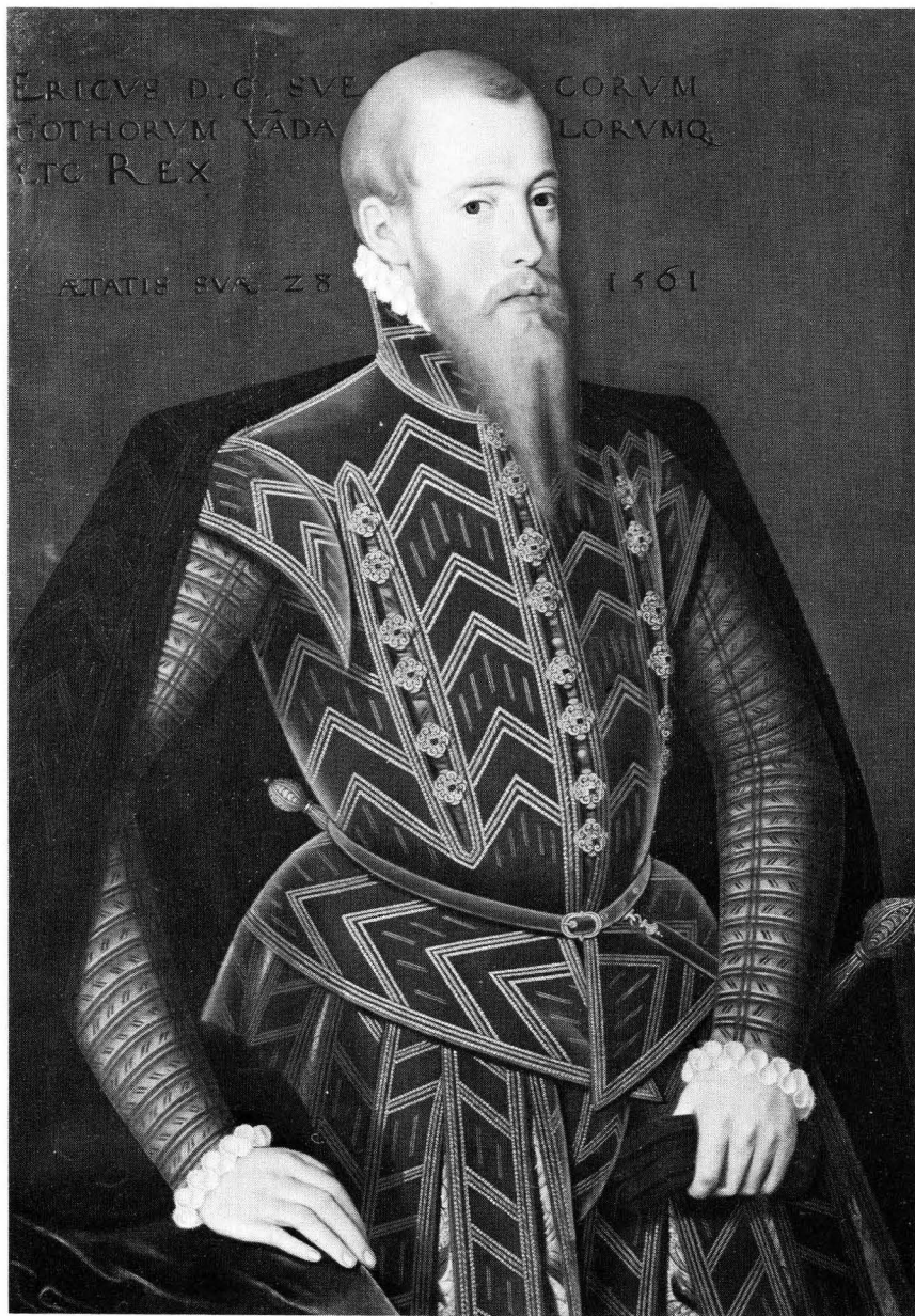
Bild 1. Erik XIV. Oljemålning av nederländsk konstnär 1561. Nationalmuseum.