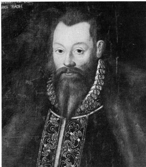
Bild 2. Svante Sture d. y. (1517–1567). Detalj av 1600-talskopia. Gripsholm.