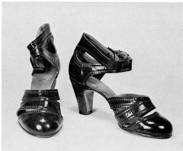
Damskor av blått skinn tillverkade på Hästens skofabrik i Uppsala omkr. 1950. Skorna ingår i en stor samling Hästen-skor som införlivats med museets samlingar under året.