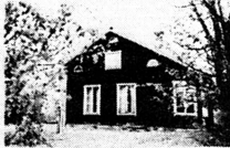
SKOGSTIBBLES bildade skola från 1838

BESTYLLA OM UTSKRÄNKNING OCH FÖRSÄLJNING AV ALKOHOL, från 1855