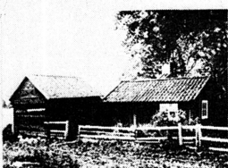
Fattigstugan i BÅLINGE