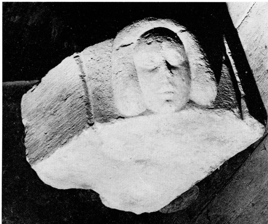
Bild 2. Den återfunna flickhuvudstenen, som ingått i det medeltida Domkapitelshusets portalbåge.

hopa följaktligen fem delar av den senmedeltida portalen. Nämnas kan att Sankt Eriksskulpturen sedan många år finns uppställd i östpartiet i domkyrkans södra portal.