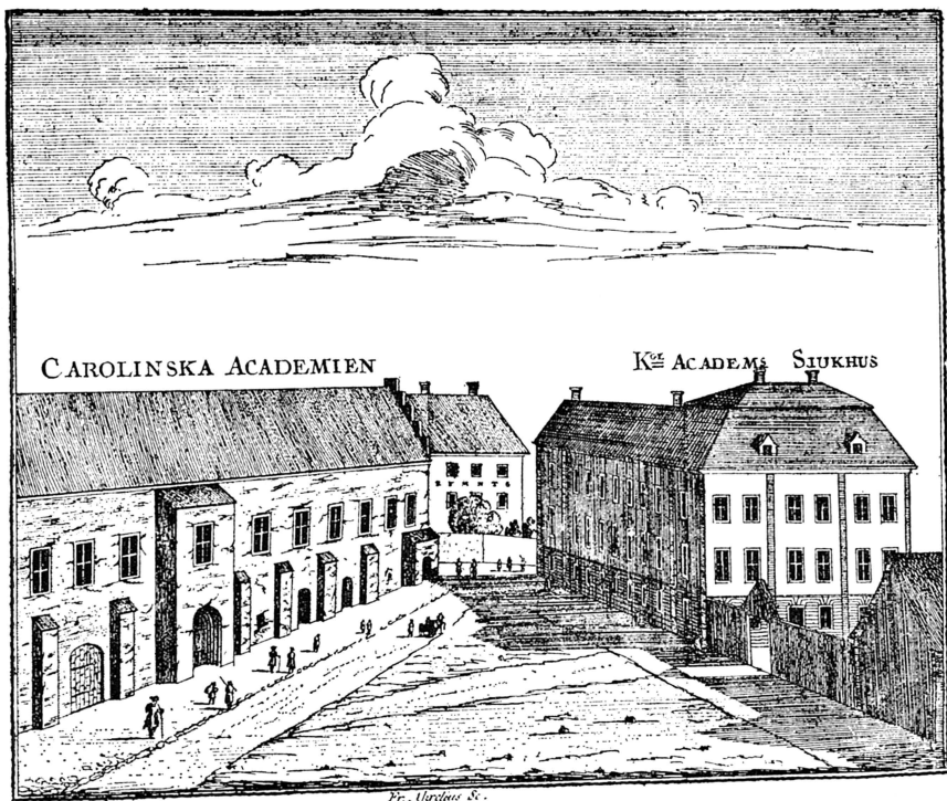
Bild 1. Riddartorget's miljö från väster omkring år 1770 efter stick av Fr. Acrel. T. v. det medeltida Domkapitelshuset från omkring 1430, sedermera universitetshus och rivet 1778. Å byggnadens norra, mot domkyrkan vettande fasad återfanns den skulpturalt rikt utformade huvudportalen, återgiven å bild 3 i vilkens båge ingått bl. a. flickhuvudet, bild 2.

uppföra det nya Domkapitelshuset , beläget på domkyrkoplanen på domkyrkans södra sida i princip mellan södra portalen och Skytteanum. Byggnaden hade uppförts med utgångspunkt från en sträcka av den bogårdsmur, som omgav Domberget och vars östra partier torde vara äldre än domkyrkan själv och härröra från konung Magnus Ladulås' tid, sannolikt åren kring 1280. 1270-talets domkyrka hade sannolikt planerat byggas i nuvarande Odinslund, på Trefaldighetskyrkans plats, men fick vid tiden omkring 1285 sin byggnadsplats bestämd till Domberget sedan konungen avstått att fullborda sin ringmursborg kring »berget». Det är under nu nämnda tid som Uppsala får sin roll som rikets »kyrkostad» medan Stockholm blir rikets främsta »kungsstad».