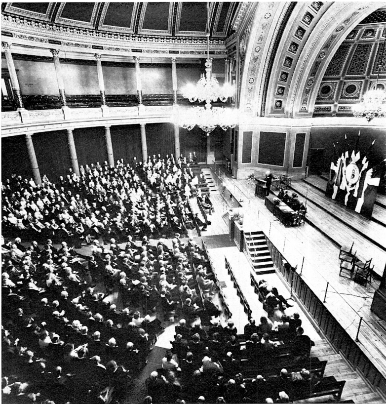
Bild 3. Från högtidssammanträdet i Uppsala universitets aula.