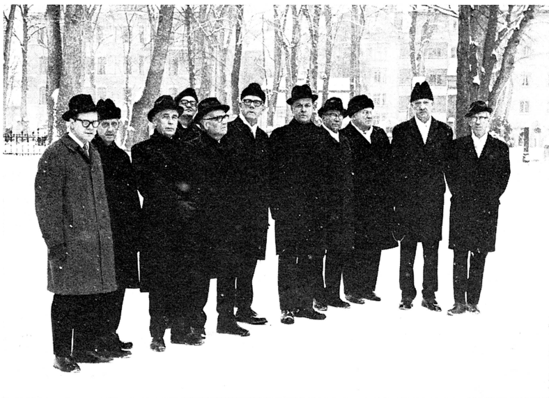
Bild 1. Medlemmar av Upplands Fornminnesförenings styrelse, samlade till minneshögtiden på Uppsala kyrkogård.

ära hade Stiftelsen Upplandsmuseet låtit iordningställa en två-salar upptagande utställning över »Vasarnas slott i Uppsala», där i historiska bilder, ritningar och modeller ingående redovisades slottets byggnadsutveckling alltifrån äldre vasatid till och med stormaktstid. Originalporträtt över samtliga vasaregenter interfolierade den livligt uppskattade utställningen. Inte minst tilldrog sig högtidsdeltagarnas intresse supplerande specialexpositioner över dels Sturemorden på Uppsala slott 24 maj 1567 och dels drottning Kristinas tronavsägelse på Rikssalen på Uppsala slott 6 juni 1654 med i särskild monter utställd den en gång kronbeprydda mantel, som drottningen bar dels vid sin kröning i Stockholms Storkyrka, dels vid avsägelseakten i Rikssalen på Uppsala slott.