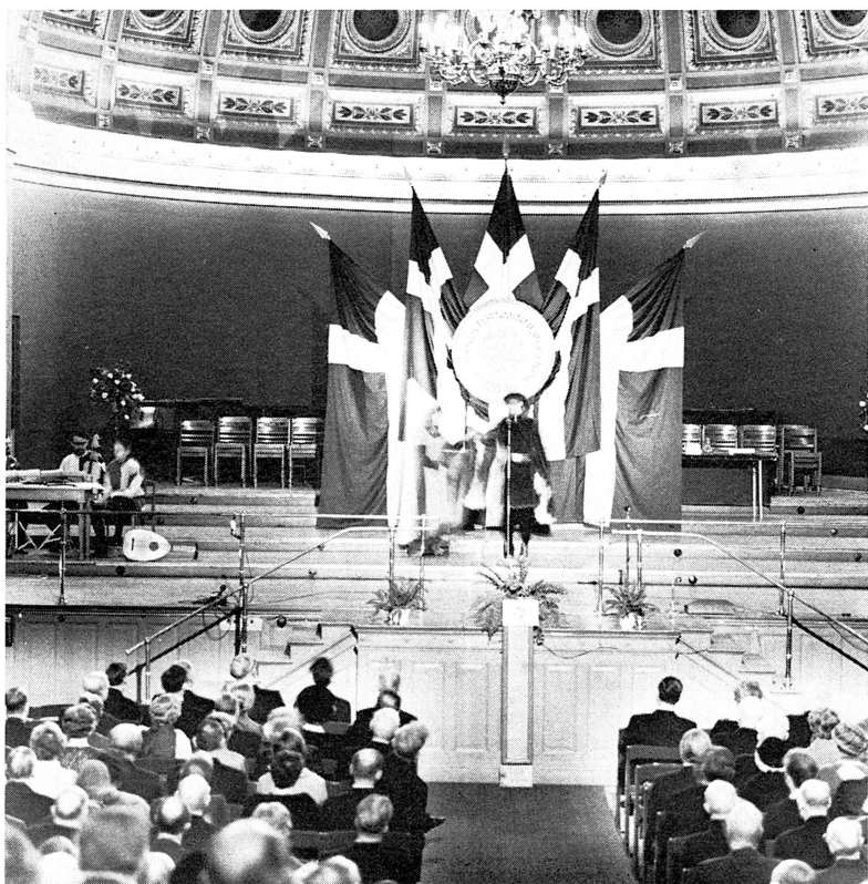
Bild 5. Från »Seklernas parad», riddartidens par inleder paraderna. T. v. Juculatores Upsalienses.

och spirituella texten, av författaren benämnd »Med hjärtliga gratulationer», finns återgiven i sin helhet i årsboken Uppland 1969. Framträdandet interfolierades med musik av Juculatores. Det överdrives ej då det säges att »paraden» mottogs av dånande applåder av den stora publiken.