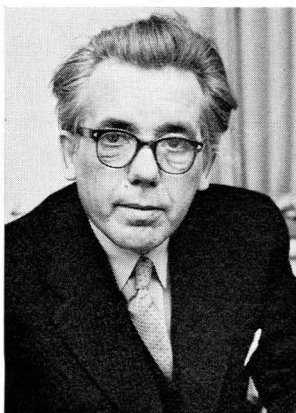
Landshövding Elis Håstad föreningens ordf. 1957–1959