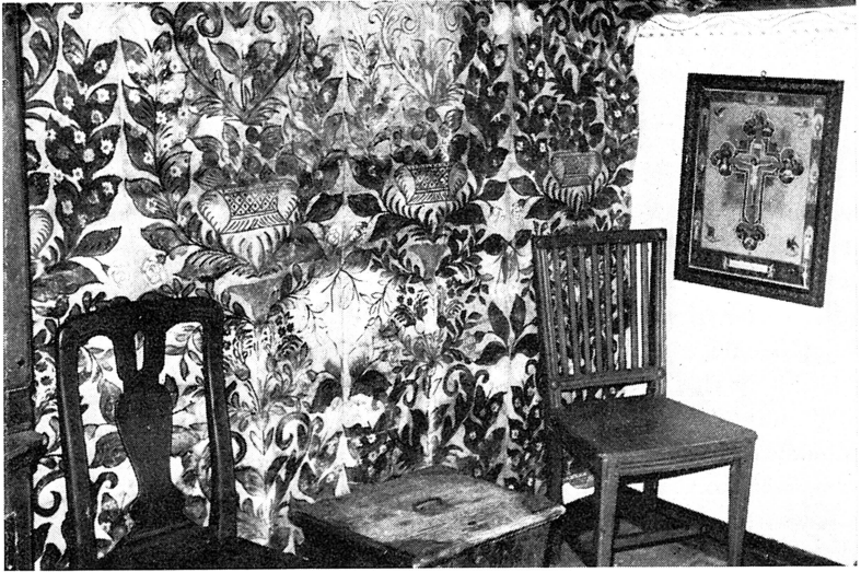
Vävtapet från den gamla gästgivaregården i Torstunaby.

bydsgården i Härled. Särskilt midsommaraftonen drog folk i skaror till den gamla gården på berget.