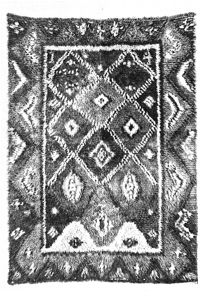
Bild 1. Rya, Skuttunge socken, Bälinge härad, daterad 1854. Allmogerya av prydnadsryctyp. Upplandsmuseet, inv.nr. 12 316.