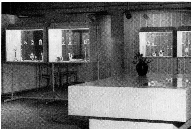
Från Upplandsmuseets utställning »Uppsalasilver» 29 sept.–3 nov. 1963.