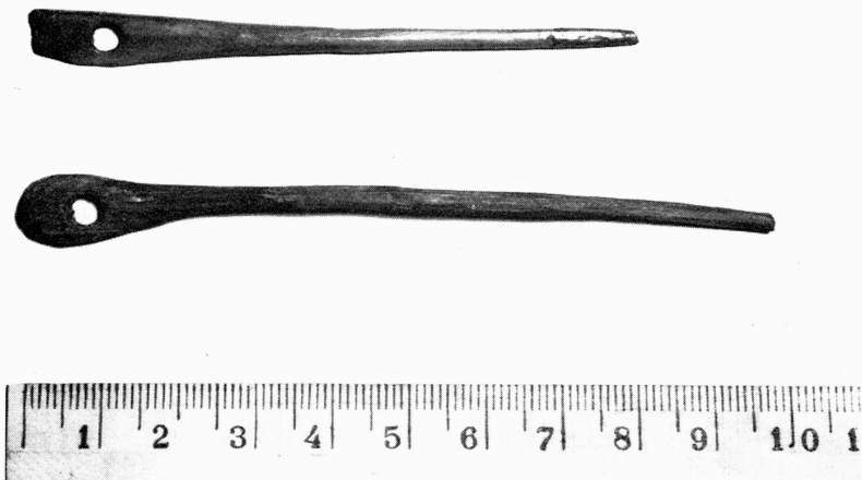
Bild 2. Nålar, troligen använda vid nålning. Jordfynd, Uppsala.

i skaftets övre kant och följer denna runt om och ned i slitsen. Den ursprungliga kontrasten kan ha bildats genom naturfärgad svart och vit ull – således kan sockan ha varit vit med en kantgarnering i svart – eller också två olikfärgade ullgarn. Tyvärr har en undersökning av garnets ursprungliga färg icke kunnat företagas.