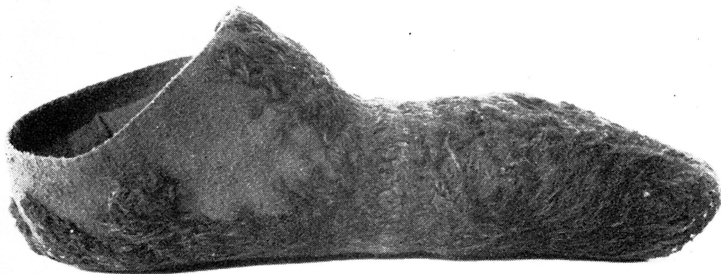
Bild 7. Socka, jordfynd från Söderköping.

några vantar från Köpenhamn och Oslo, de flesta troligen medeltida. 9 Även på finskt område har man funnit bl. a. en vante från yngre järnålder. 10