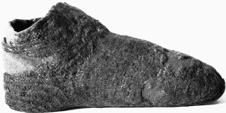
Bild 5. Ena sidan av sockan efter företagen konservering.

Fyndomständigheterna tyder således — med en viss osäkerhet — på en datering av sockan till senmedeltiden. Även dess form gör denna datering trolig. Ty som förut påpekats påminner den starkt om en medeltida skotyp. Den folkliga fotbeklädnad i nålning, som fortfarande utföres på sina håll i vårt land, liknar snarast en sandal och har ett betydligt enklare utförande, oftast i tagel. De användas nu för tiden som värmande inlägg i stövlar. Men denna socka är så liten och fint arbetad, att man helst ville tänka sig den gjord till en nätt damfot som en lättare fotbeklädnad för innebruk.