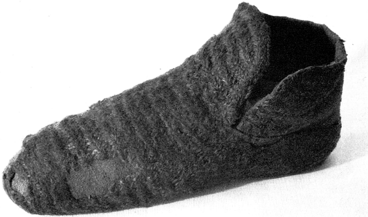
Bild 6. Sockan från andra sidan med djup slits i vristpartiet. Längs övre kanten löper en mörkare, dekorativ snodd.

Egendomligt nog har till Riksantikvarieämbetets textilkonservering denna vår inkommit ännu en socka utförd i nålning med ullgarn, funnen vid grävningar i Söderköping. Den är betydligt grövre och icke så elegant i formen som Uppsalasockan, bild 7. Stark filtning har hindrat en analys av bindningstekniken. Emellertid har den hittats under omständigheter, som kan föranleda medeltida datering.