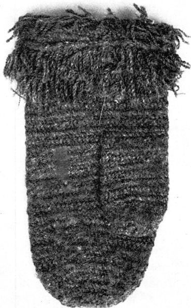
Bild 8. Nålad vante från Alsike sn, Uppl. (NM 9220 a).

folklig konst lever denna variant kvar framför allt i framställningen av vantar. Från Uppland finns dock inga dokumenterade enligt vad som hittills publicerats.