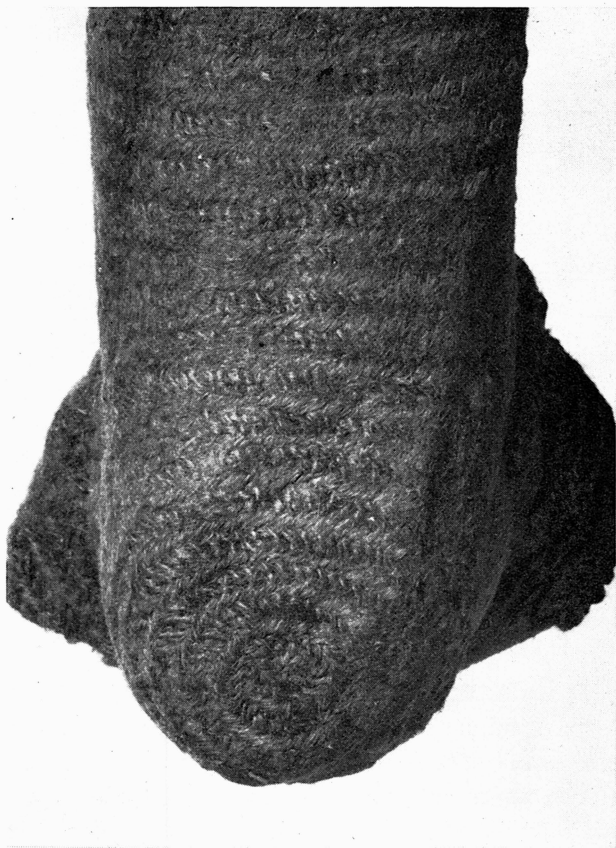
Bild 4. Sockans hälparti underifrån.

Lund. 3 Detta har emellertid två djupa slitsar, en på vardera sidan. 4