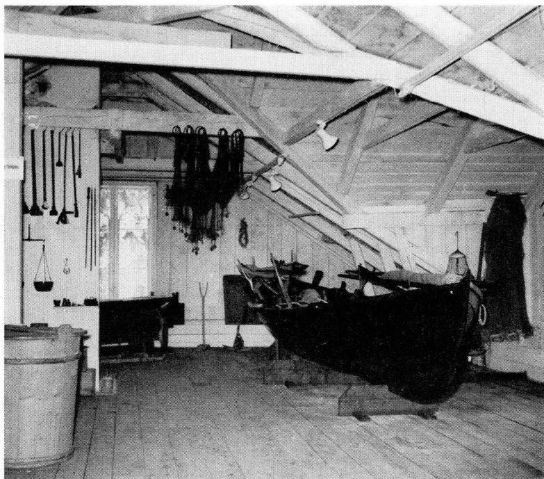
Bild 2. Från det i övre våningen på »Blombergs Udde» inredda Vaxholms museum.

föreningens sak i Vaxholm. Man har haft sammanträden med föredrag, man har samlat bilder och arkivmaterial och föremål från hemstadens äldre historia. Genom åren har alltid drömmen varit att skapa ett eget hem för föreningen. Detta senare mål har nu äntligen nåtts i det att föreningen under 1962 kunnat öppna portarna till en egen gård, som icke blott omsluter trivsamma samlingslokaler utan även inrymmer ett innehållsrikt hembygdsmuseum.