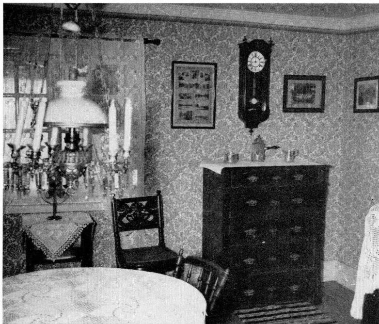
Bild 3. Interiörbild, finrummet, i Smedstugan vid Älvkarleö.