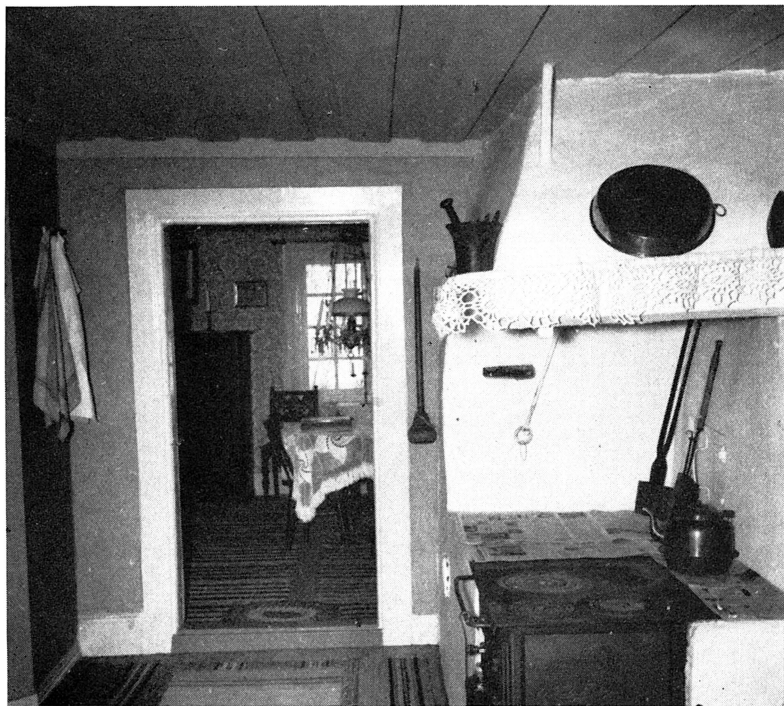
Bild 2. Interiörbild, med blick från köket in i finrummet, Smedstugan vid Älvkarleö.