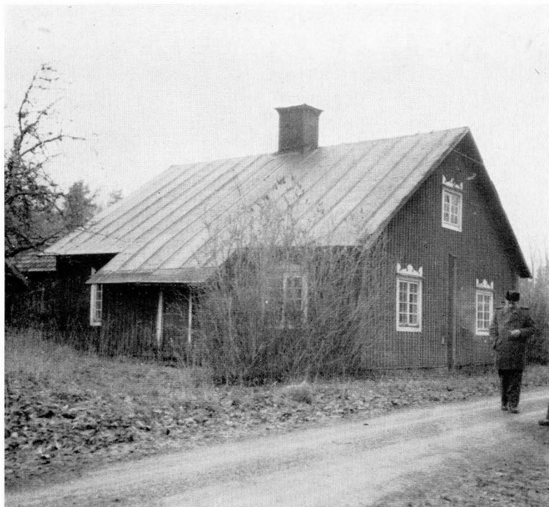
Bild 1. Den gamla smedstugan vid Älvkarleö, nu inredd till hembygdsmuseum av Älvkarleby hembygdsförening.

många älvkarleöbor, som i smedslägenheten »känner igen» sitt barn-doms-hem.