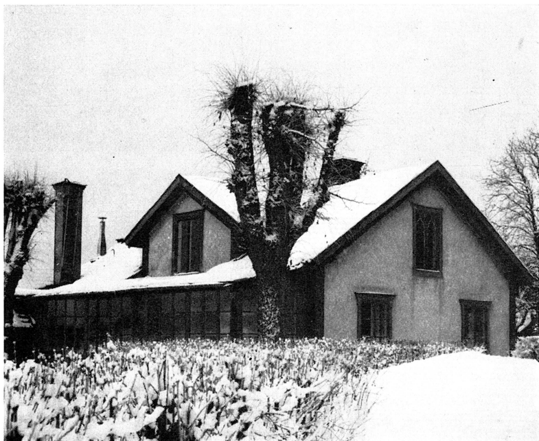
Bild 1. »Blombergs Udde», som av Vaxholms hembygdsförening iordningställt som samlingslokal och museum.

Vaxholms hembygdsförening, som bildades 1942 på Karl Martins initiativ, har under de gångna tjugo åren målmedvetet arbetat för hembygds-