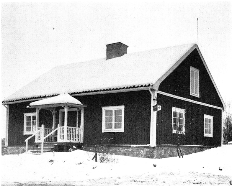
Bild 1. Stugan vid Ytterby, som av Täby hembygdsförening iordningställts som museum och samlingslokal.

kommunen upplåtits till hembygdsföreningen. En del arbete återstår dock, särskilt när det gäller att få de kulturhistoriska samlingarna ordnade i mera slutgiltig form. Det tredje målet återstår att nå, att bevara en hel gårdsanläggning. Därom mera nedan.