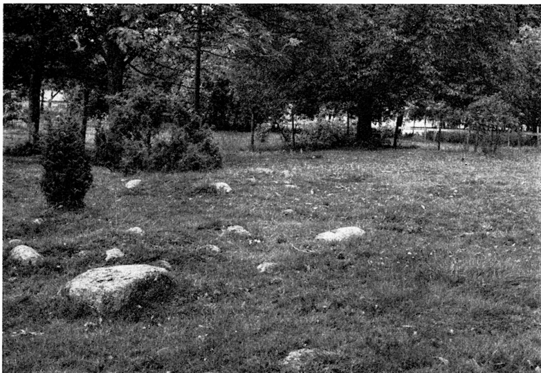
Veckholms pastorats hembygdsförening. Tingsplatsen vid Enhälga, Villberga s:n.