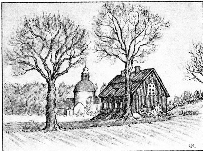
Solna hembygdsförening : Falkenerarbostället vid Solna kyrka, nu hembygdsmuseum. Teckning av U. Rejle.

arbetet. Han knöt bl. a. förbindelser med andra hembygdsvårdande institutioner och sammanslutningar.