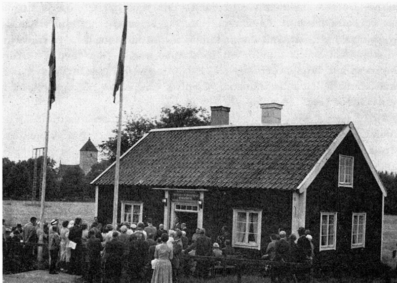
Från invigningen av hembydsgården Vrån i Norrsunda.

När pensionärshemmet i Rosersberg häromåret togs i bruk friställdes den gamla fattigstugan Vrån i Åshusby i närheten av Norrsunda kyrka. Hembygdsföreningen inköpte stugan av kommunen för 5 000 kr. och sedan den iordningställdes med rumsinteriörer på nedre botten och museum i vindsvåningen kunde den invigas söndagen 28 aug. 1960.