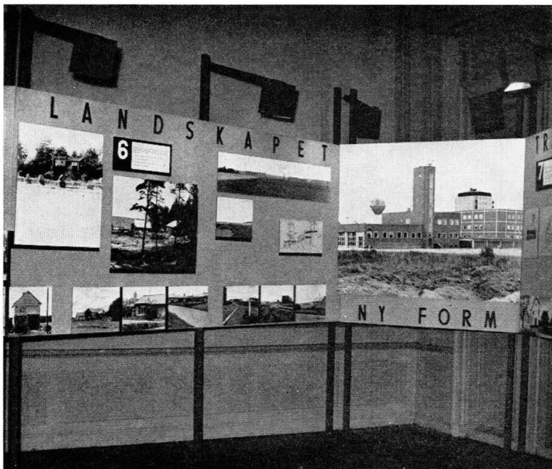
Bild 1. Från utställningen »Vårda Uppland» med bildmontage över bebyggelsen och landskapet.