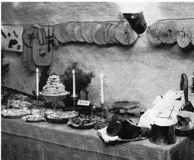
Bild 2. På utställningen »Vår brödtradition» hade man samlat de olika bröd-sorterna sockenvis. Här en del av Björklinges bord med bl. a. frukt- och bärkakor av olika slag, korintkakor, rågbröd och smörtårta.

m. m. Entrén till utställningen, i nationens bottenvåning, dominerades av en rund omkring 3 m lång panoramabild, fotograferad från Vaksala kyrkas tornspira ut över det kringliggande landskapet. Denna bild innehöll många av de faktorer utställningen i övrigt sysslade med, bl. a. stadens möte med landsbygden, den gamla byn, den öppna slätten möter skogsbygden m. m. I uppgången till de övre utställningslokalerna hade man skärmar med foton, som beskrev det ålderdomliga kulturlandskap Uppland utgör och som till en del finns kvar men som alltmer får ge vika för vår egen tids påfund av både ont och gott. För rummet en trappa upp – »chockrummet» kallat – var ägnat åt framförallt anläggningen av Arlanda flygfält, en av de största och mest revolutionerande landskapsförvandlingar som sker och skett i Uppland. Stora utställningssalen var ägnad flera olika problem, inte minst de