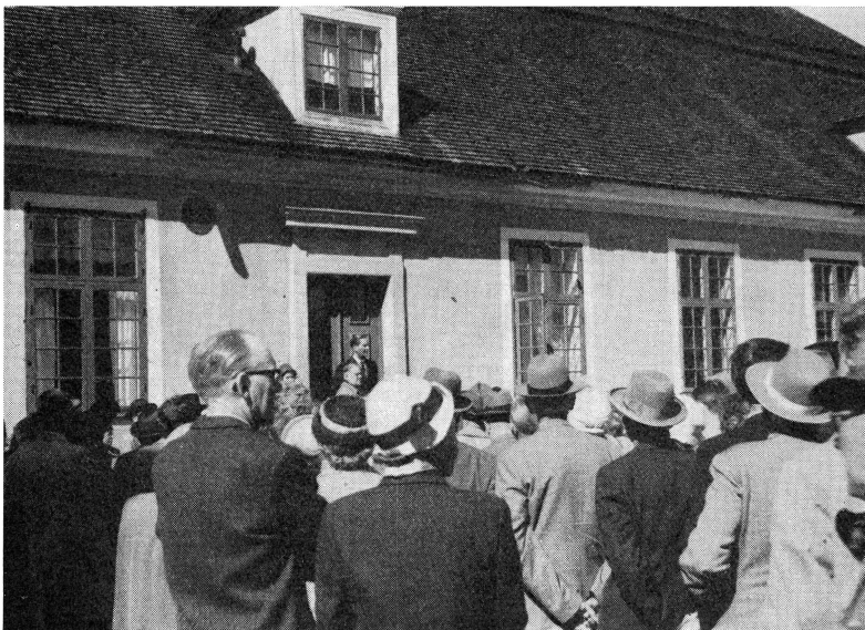
Bild 5. Friherre Carl de Geer berättar om Leufsta bruk från trappan till en av herrgårdens flygelbyggnader.