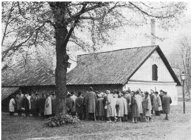
Bild 2. Några av utflyktsdeltagarna samlade utanför den gamla vallonsmedjan vid Österby bruk.