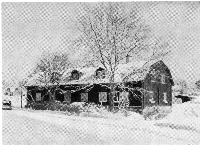
Bild 5. Rotebro gästgivargård, Sollentuna.

korn och hafra, hö och halm för hästarne». Kostnaderna skulle regleras genom en särskild taxa, fastställd av landshövdingen. Där finner man att en middag om tre rätter kostade 12 öre, ett glas brännvin 2 öre. Priset för nattlogi uppgick till 4 öre.