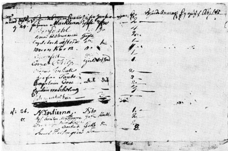
Bild 7. Ur Östanå gästgiveridagbok för februari 1792 med kapten Anckarströms namnteckning.

rest», »väl undfägnad och expedierad». De många resande, som inte antecknat något i anmärkningskolumnen, har nog varit fullt tillfredsställda. I ett kungligt brev år 1814 beordrades gästgivarna att i dagboken anteckna om den resande uppvisat pass eller var »känd i orten».