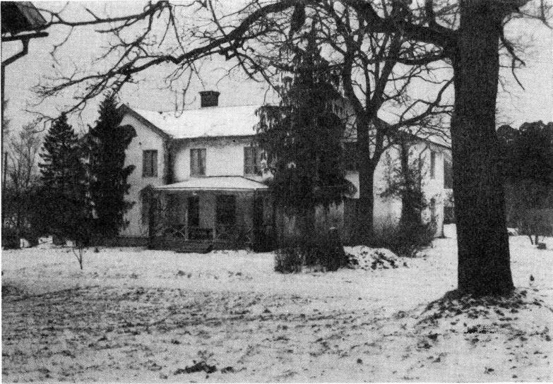
Bild 4. Gästgivargården i Mehede. Tierps socken.

En fransman, på resa i Sverige året därpå, har berättat följande från Östergötland: »Den 6:te kommo vi till Öster-Husby, där vi i brist på sängar lågo i halm på golvet.» Det var ju mindre angenämt; mera belåten tycktes fransmannen ha varit med dryckesvarorna: »Några foro förut för att bestyra; ty svenska härbärgen äro ej inrättade för stort sällskap. Ingenting fattades för vår förtäring, icke en gång spanskt, franskt eller rhenskt vin; öl kunde man få överallt i städerna och i byarna.»