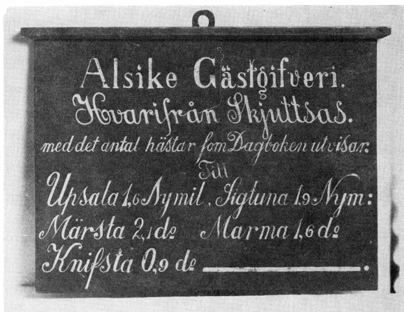
Bild 2. Skjutstavlan från Alsike gästgivargård. Var placerad till höger om ingången, se bild 1. Tillhör Upplandsmuseet.

Alltjämt förekom våldgästning ute i landet. Det blev därför nödvändigt att till Alsnöstadgan bifoga straffbestämmelser för att den skulle efterlevas. Bestämmelserna var mycket stränga. I Skänningestadga av år 1335 heter det: »att den som med våld tog något av eller med våld gästade hos gästgivare, präst eller bonde skulle mista livet för konungens svärd vare sig han var hög eller låg, även om det han tagit ej vore värt mer än ett höns».