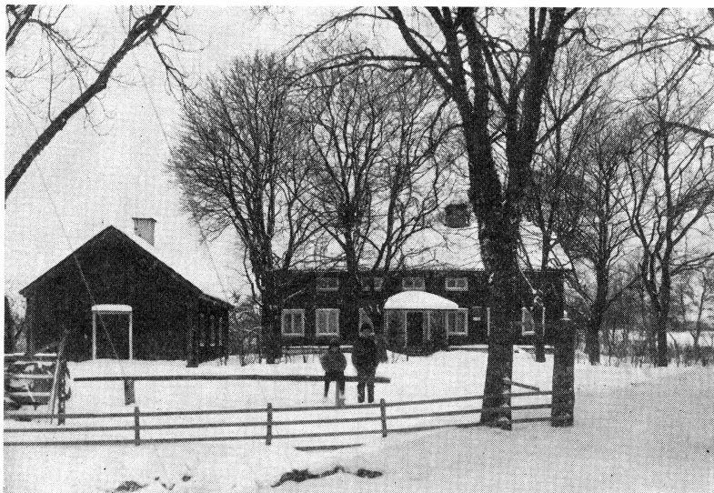
Bild 1. Alsike gästgivargård.

inte själv ta emot de resande fick han hänvisa dem till andra bybor. Vägrade en bonde att erbjuda en resande vad denne behövde, kunde domen bli 3 markers böter. Fullgjorde ej heller rättaren sin skyldighet fick han böta dubbla beloppet.