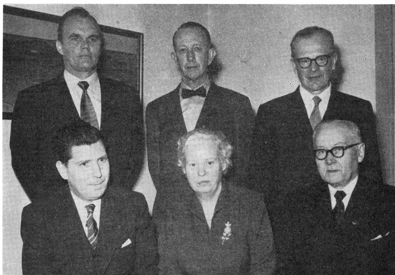
Bild 3. Järlåsa hembygdssförenings deputation, som vid Disa Gille 1957 mottog belöningen ur Landshövding Hilding Kjellmans hembygdssfond.