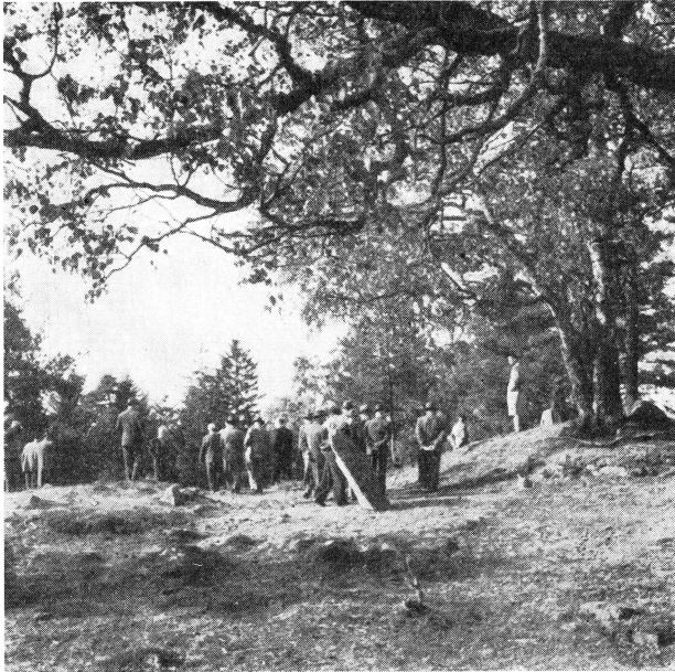
Bild 1. Det vidsträckta gravfältet vid Vaxtuna i Orkesta socken studeras ingående.

Upplands fornminnesförenings höstutflykt 1955