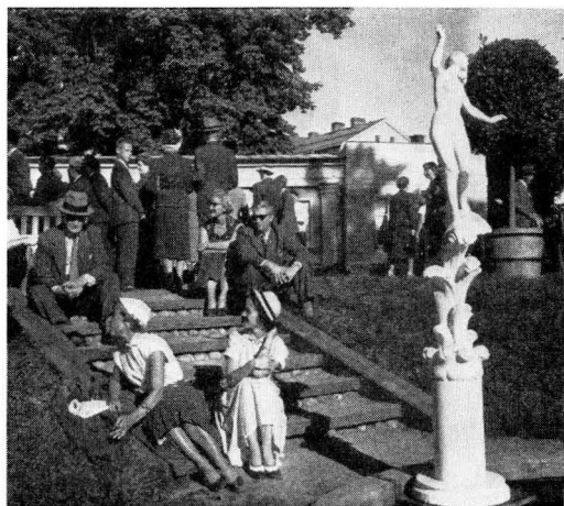
Bild 1. Från utställningens öppnande.

I bassängerna och inom rabatterna framträdde i skön glans mot grönskan det ena verket efter det andra. I det nyrestaurerade orangeriet erhöll man kompletterande bilder av Carl Eldhs verksamhet, särskilt med