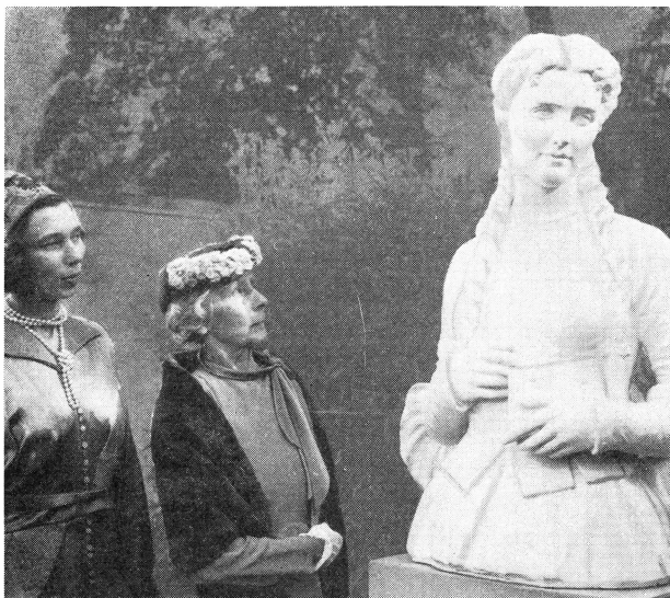
Bild 2. Bildhug- garens maka och dotter betrakta Kristina Nilsson.