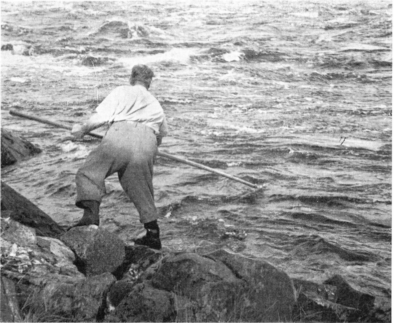
Bild 2. Det gäller att hålla balansen när man hävar lax i forsen.

inför herr Sten, som vid ett möte i Gävle förgrymmad talade om »den skada, som var honom vederfaren på rikets fiske i Älvkarleby, vilket blivit uppkastat, fördärvat och nerbränt av några av deras egna landsmän, riket till förfång och fattiga män i Älvkarleby till stor skada». I en synerättsdom med anledning av våldshandlingen samma år heter det bl. a.: »Vi efterskrivne göra veterligt, att året efter Guds börd 1473 på lördagen näst före den söndag, som man sjunger Oculi , voro vi skickade av ärlige och välborne herr Sten Sture, riddare och riksföreståndare, till Älvkarleby att bilägga uppå rikets vägnar en träta, som länge varit rådande mellan allmogen i Färnebo och Hedesunda socknar och Älvkarleby fors och konungsfiske». Synenämnden förklarade efter ingående bevisföring om vad som är rätt och riktigt att »den översta byggnaden, som är mellan västra landet och Laxön, skall bliva stående och hållas vid makt, som hon nu byggda är och tillförne varit och skall bliva under konungens och rikets fatabur till evig tid och skall aldrig mera efter denna dag bliva uppkastad vid riksens stränga hämnd och plikt».