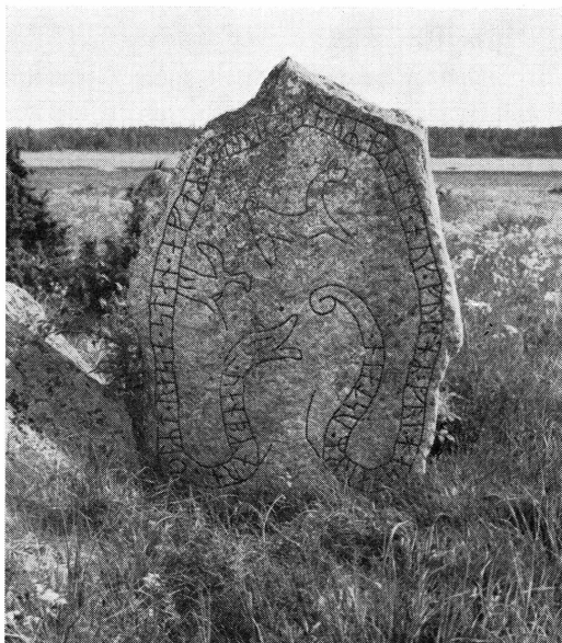
Bild 2. Knutby sockens vackra runsten vid Burvik. 1000-talets mitt.