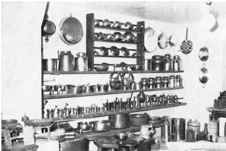
Bild 1. Avdelningen för husgeråd på den rikhaltiga utställningen i Vidbo.