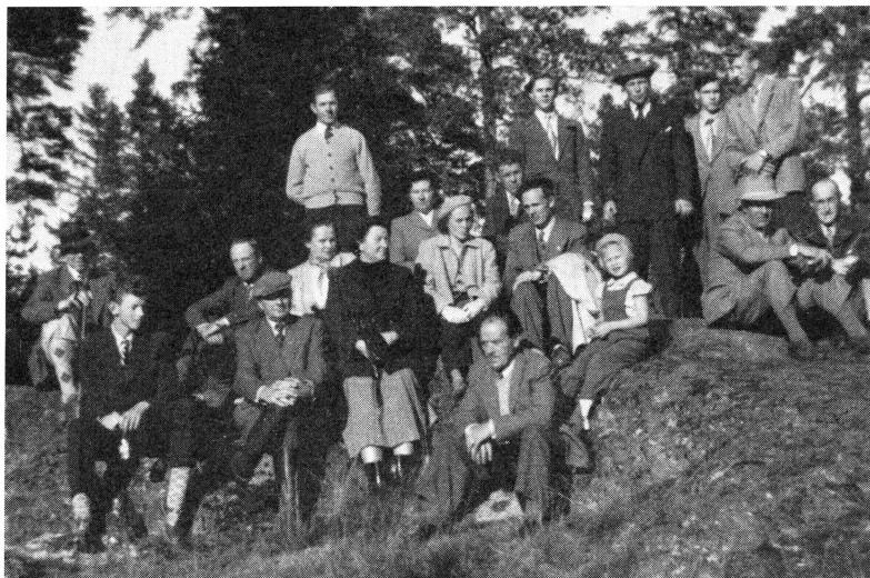
Husby-Ärtinghundra hembygds- och fornminnesförening: Deltagarna i hembygdsföreningens utflykt till Steninge hösten 1953 samlade på utkiksberget.

är en s. k. holländare och de tillhöra ju den större typen av kvarnar, varför en flyttning torde bli rätt dyrbar.