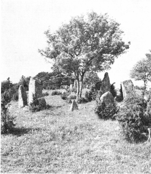
Bild 1. Gravfält med bautastenar vid Gränsta från tiden Kr. f.—200 e. Kr.

gångna tjugofem åren och i övrigt är rik på kulturhistoriskt stoff. Flera gamla knutbybor berätta minnen från gångna tider i tidningen. En vägledning över Gammelgården och dess samlingar har utarbetats under medverkan av intendent Nils Ålenius och tryckts. Därmed har en gammal dröm förverkligats. Det lilla vackra häftet har redan visat sig vara och kommer att bli en god ledning för besökare och intresserade.