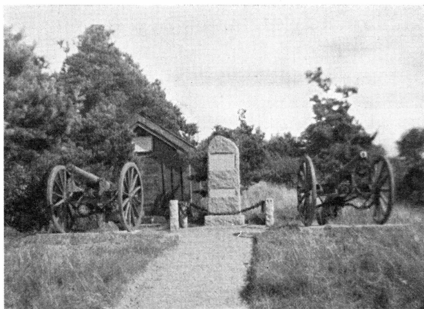
Husby-Ärtinghundra hembygds- och fornminnesförening: Monumentet vid Arenberga med de nyuppställda kanonerna.