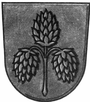
Tierps köpings och Tierps landskommuns nya vapen.

Både köpingen och landskommunen ha tacksamt accepterat erbjudandet från gillet och beslutat återuppliva bruket av det gamla vapnet i enlighet med förslaget.