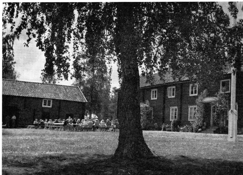
Västerlövsta hembygdsförening: Midsommarafton på Västerlövsta hembygds-gård. Saftkalas sedan årets konfirmander klätt majstången.