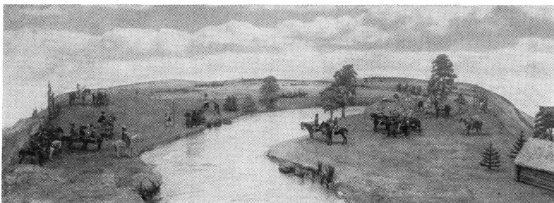
Freden vid Stångebro år 1598 i tennsoldatsdiorama.

Uppställningar, ja, ty tennsoldaten är till sin natur en massfigur och samlarna försökte med den som medel återge händelser från skilda historiska skeden. Nya figurer från alla tänkbara perioder av mänsklighetens och jordens historia skapades i takt med de moderna arkeologiska utgrävningarna och det historiska sanningssökandet. Uppställningarna kallar samlarna »dioramor» och många av dessa omfattar 1000-tals figurer och upptar flera kvadratmeter i yta. Allt från skräcködlor till moderna stridsvagnar dök upp i typkatalogerna. Under de sista 25 åren har det säkerligen kommit fram 10 000-tals typer av tennfigurer, fullt ägnade att riktigt återge episoder i vår och världens historia vad dräkter, utrustning etc. anbelangar.