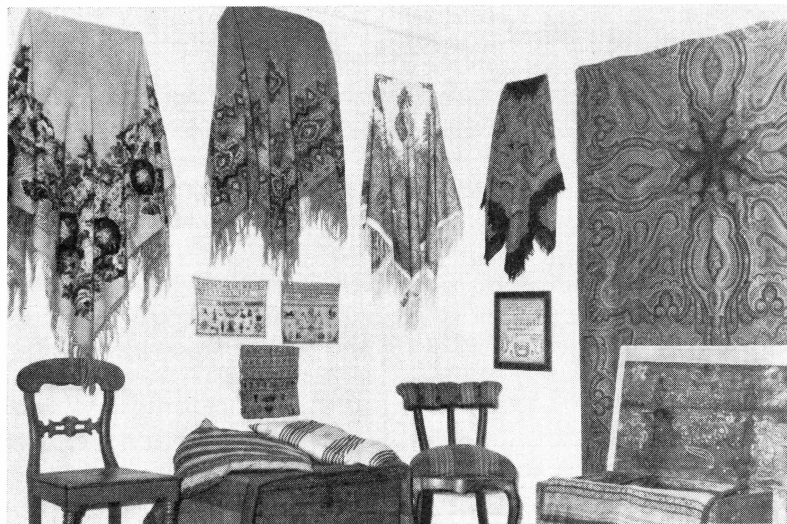
Bild 2. Ungmorsschalar och märkdukar på Vidboutställningen.