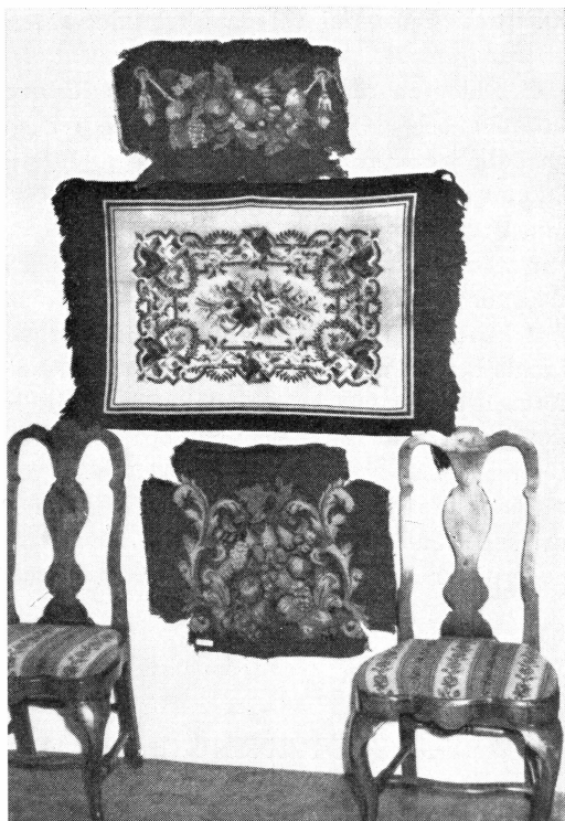
Bild 3. Herrgårdskulturen var representerad av bl. a. stolar i engelsk rococo, gobelängklädslar till möbler från 1600-talet samt en korsstygnsmatta från 1840-talet.