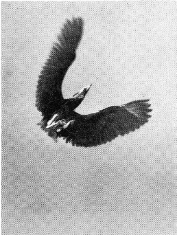
Bild 4. »... flyger han in spiram rätt upp». Carl v. Linné 1748.

och så mycket hemskare. När rördrommen kom till Garnsviken vid Sigtuna trodde man att det var tjurarna på Ala gård som sluppit lösa om natten och vrålade. Lätet är ett dovt mistlursljud och mellan blåsningarna rosslande och stönande. »Hu hu hu-u-domp, hu booh, hu BOOH, hu BOOH, BOH» låter det.