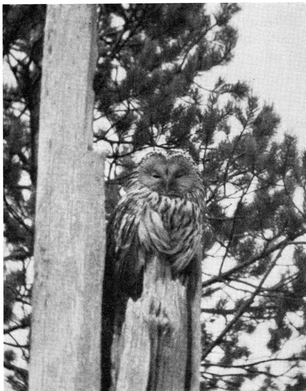
Bild 6. Slaguggla.

låter naturligtvis förstå att det har funnits uv i Upplandsskogarna. Nu heter det bara prosaiskt Uvberget. Ram hette korpen och bjur bävern, som nu båda är försvunna ur Upplands fauna, men vid Trangölen, Tranmossen och Tranmyren finns det förstås tranor, kanske än i dag.