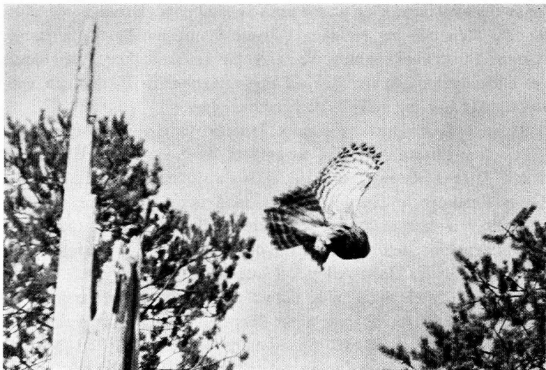
Bild 7. Slagugglan i flykten.