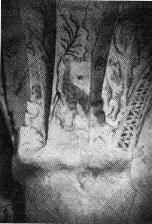
Bild 1. Det är sannolikt en rördrom som en av Mälardalens kyrkomålare, samtida med Albertus Pictor, målat på valvbågen i Gryta kyrka 1487.

till fågelns storlek oproportionerligt kraftiga fötterna med deras långa, om röddrommens påminnande tår. Är fågeln en ibis? Ja, kanske. Eller en rördrom? Ja, inte bara kanske utan t. o. m. troligen.