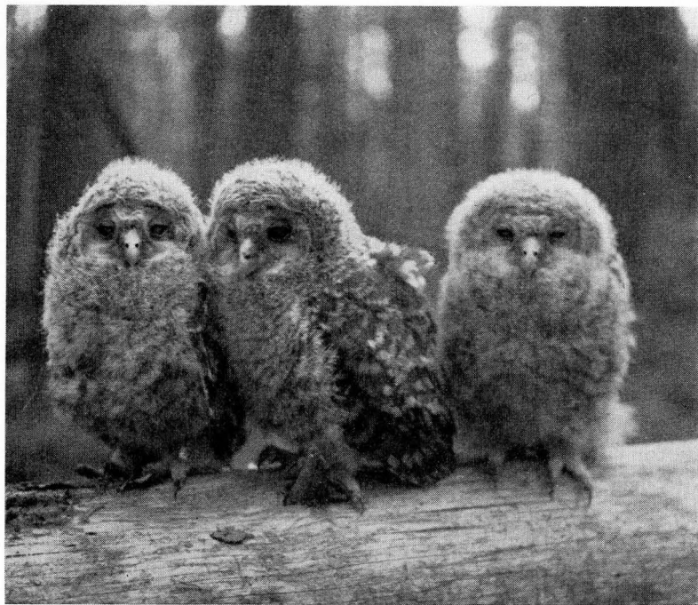
Bild 8. Slaguggleungar.

och ungarna i fred. I slagugglornas skog håller inga människor råfst och rättarting. Nu råkade det tydligen bara bli så att tjäderhönan valde fel granne och kom att ligga i vägen. Låt oss inte döma den övervägande oskadliga för att inte säga nyttiga ugglan för det. Allra minst med tanke på vad som inträffade jämnt ett år senare.