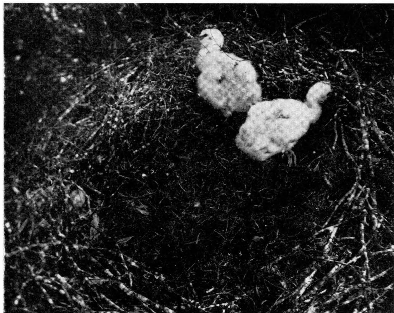
Bild 5. Odinsvalans ungar i boet i Västland 1941.

någon och med en i förhållande till fågelns litenhet ovanligt stark och välljudande sång.