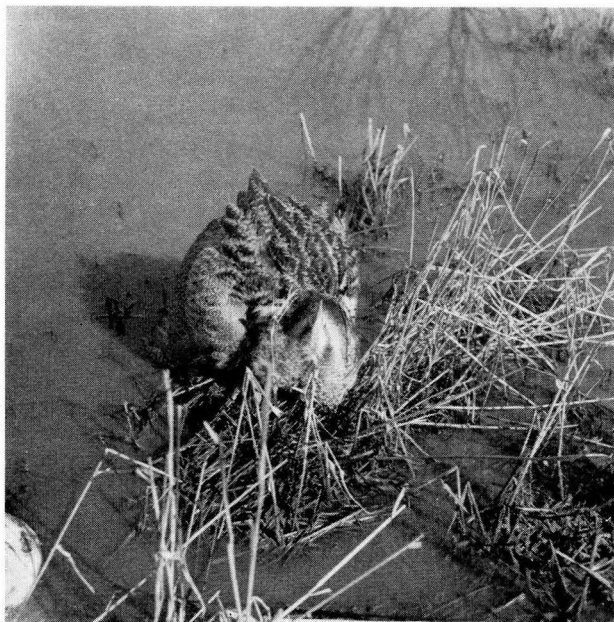
Bild 3. Rördrommen trycker i vasskanten.