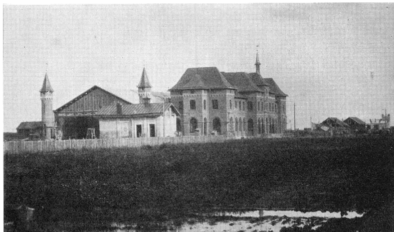
Bild 8. Stationshuset i Uppsala 1866.