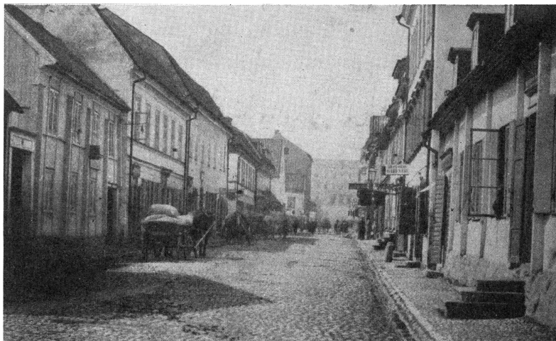
Bild 7. Vaksalagatan på 1860-talet.